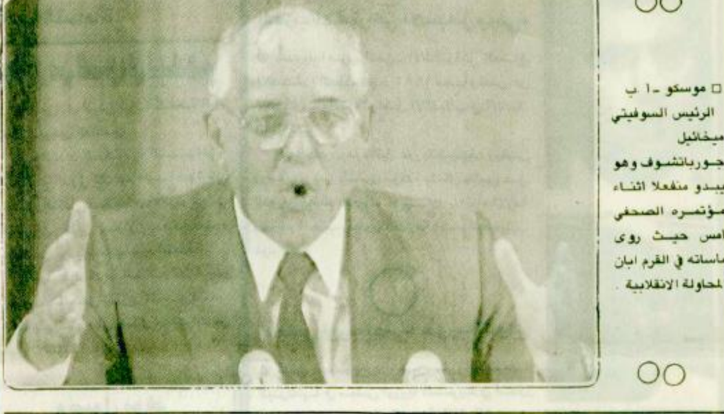
الرئيس السوفيتي ميخائيل جورباتشوف وهو يبذل مفعلا أثناء مؤتمره الصحفي امس حيث روى مأساته في القرم ابان المحاولة الانقلابية.

موسكو - العواصم - الوكالات في اول مواجهة مع الصحافة العالمية منذ فشل الانقلاب في الاطاحة به روى ميخائيل جورباتشوف في موسكو امس كيف رفض كافة المحاولات لحمله اما على التنحي او الموافقة على اجراءات الطوارئ التي اتخذها زعماء الانقلاب. وقال جورباتشوف في مؤتمر صحفي حاشد بمقر وزارة الخارجية السوفيتية انه حذر المبعوثين الذين ارسلهم قادة الانقلاب الى متجنمه بالقرم من ان قادة الانقلاب يقومون