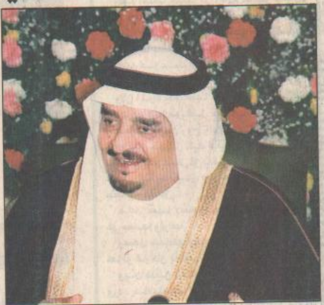
خادم الحرمين الشريفين جدة - واس بعث خادم الحرمين الشريفين الملك فهد بن عبدالعزيز آل سعود برقية تهنئة الى فخامة الرئيس حافظ الأسد رئيس الجمهورية العربية السورية بمناسبة ذكرى يوم الجلاء.