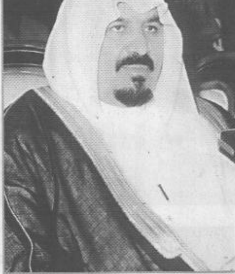
سمو النائب الثاني

ضمان السلم والامن. وفي اجابة عن سؤال بشأن احتمال عقد قمة عربية قال سموه هذا شأن سترسره الجامعة العربية وتتخذ منه الموقف الذي تراه الدول العربية سليما وتعمل فيه الى الخواتيم الصالحة. وحول رأي سموه في دول اعلان دمشق قال: (إنها تسير بخطى ثابتة نحو الغايات التي قامت من اجلها وهي تحقيقها بسلامة ونجاح). وعن اجتماع مجلس وزراء الدفاع العرب قال: نحن نحرص على كل لقاء مع شاشتنا يكون من شأنه خدمة الامم ومصالحها. وبشأن الخلافات الحدودية بين العرب وكيفية الاجراء نحو وجود حل لها. قال بكثير من المحبة والتفاهم والاخوة وهذه كلها مناهج تأمل لها ان تحقق مزيدا من الصفاء والرسوخ. وعن لبنان والسلام ومدى قربه اجاب سموه: (إذا استجيب المطالب العربية العادلة المستندة الى الشرعية الدولية لحلحال السلام في منطقتنا وتأمل ان نسمع في القريب عن مبادرات تقضي الى حل سلمي شامل وعادل). وحول اطمئنان المملكة الى مستقبل لبنان قال سموه (المملكة تحب لبنان وخادم الحرمين الشريفين الملك فهد أعطي دائما اذلة على ذلك وما الطائف ونجاحه الا شاهد على هذه المحبة والسعوديون يستمتعون في لبنان ويحبون لبنان ويشركون في المؤتمرات الاقتصادية والمالية لخبر لبنان وهم يمتلكون في البلد الذي يجونه والذي تأمل له ان يتعاضد بشكل كامل.