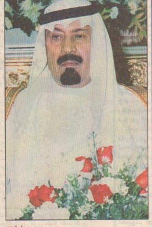
سمو ولي العهد

ويابدة الطائف، وقال معاليه «اليوم» : باسمي وشيابة عن أهالي الطائف نرحب بسموه وصاحبه الكرام في عروس المصايف، وتمنئني لسموه - حفله الله - طيب الإقامة في هذا الجزء الغالي من مملكتنا الغالية. وسال ابن عمر الله - عز وجل - أن يحفظ قائد مسيرتنا خادم الحرمين الشريفين الملك فهد بن عبدالعزيز وسمو ولي عهده الأمين وسمو النائب الثاني. من جانب آخر عبر وكيل محافظة الطائف عبدالله بن ماضي الربيعة عن بالغ سروره بهذه الزيارة الغالية وقال إن الطائف تنتظر هذه الزيارة بشغف كبير لأنها في شوق لسمو سموه الكريم. وعبر معالي محافظ الطائف الأستاذ فهد بن عبدالعزيز عن معمر عن سعاده بهذه الزيارة الكريمة التي ينتظرها حاضرة