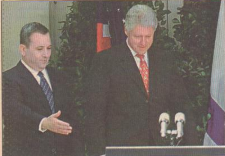
الرئيس بيل كلينتون ويهود باراك خلال محادثتهما في البيت الأبيض أمس