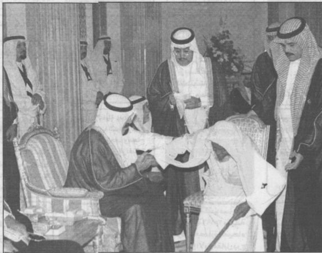
سمو ولي العهد يساعد احد السنين على الجلوس

بأل سعود حقق الله فخرها فوحدها الإيمان والسيف والزند فسارت وعين الله تكلم أهلسها فتخسا من حسادها الاعين الرمد ونحن بعهد الفهد في عصر نهضة بنا صرحها الاخلاص والمال والجهد وجزان قد نالت من الخير حظها ومازال نهر الخير يأتي به المد ووقفتكم حين استبد به السبلا فسار بفضل الله بخيو ويرند وقد مسحت عنا يد السعد حزننا ووزرتم وفي اقبالكم اقبل السعد وجزان تهديكم من الحب فلها وابناؤها في قلل دولتكم جسد وفي موطن التوحيد نرفع راية ونحني حصى التوحيد ان حصل الجد وما انتمو ياموئل الجود والندى يفوح على جازان من طبيكم ورد فتمتد بالحب العظيم يمينكم لمن هم بكل الحب ايديهمو مندوا فتهدون جازان الوفية منكممو هماما بدين الله يسمو ويعتد ليكتب في سفر الحضارة معلما وفي وطن التوحيد ينتشر الرغد ويمضي بجازان الاصيله للعلى يسده في سعيه الواحد الفرد ونحن جميعا في سرور ونجبة يمقدمه أفراننا مالهنا حد وهانحن جننا والولاء يقودنا وبالحب والإجلال قد اقبل الوعد لكم شكرنا يا صاحب الفضل سابقا ودمت لنا يامن به يفخر العهد. وحضر الاستقبال صاحب السمو الأمير عبدالله بن محمد بن عبدالعزيز آل سعود صاحب السمو الملكي الأمير محمد بن مشاري ابن عبدالعزيز وصاحب السمو الملكي الأمير نايف بن معديج بن عبدالعزيز وعدد من المسؤولين.