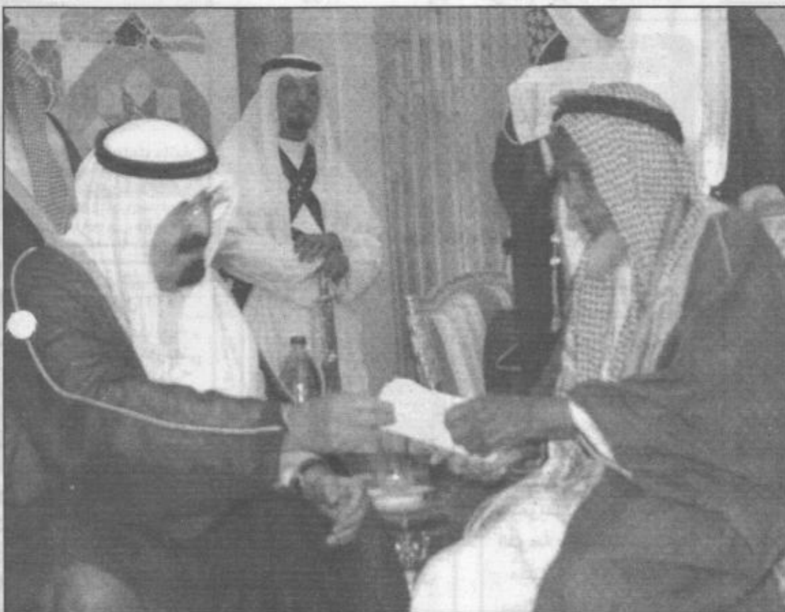
سموه يستمع باهتمام إلى احد المواطنين

أهالي جازان من شرفات الجبال إلى مياه البحر.. لا ينسون لسموكم الرحلة التاريخية من (نيس) الفرنسية إلى جازان