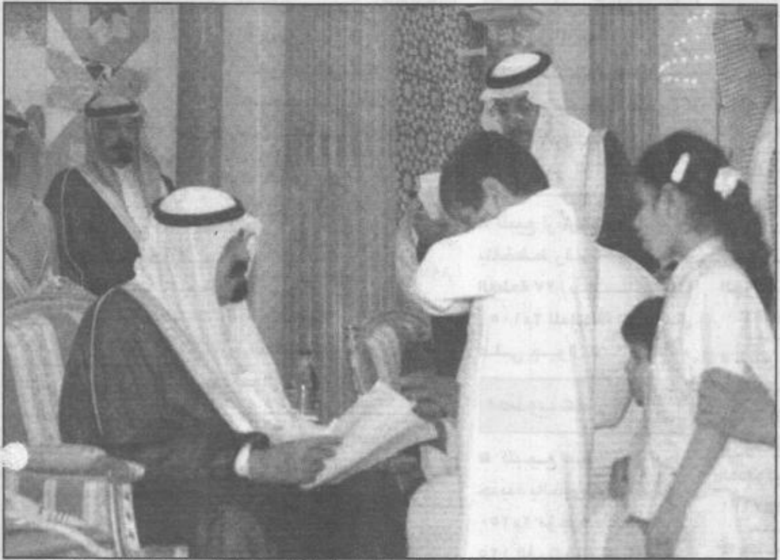
الأمير عبدالله يستمع بآبوة حانية إلى بعض الأطفال الذين تشرفوا بالسلام على سموه.

إبراهيم الشعبي: الملك عبدالعزيز، طيب الله ثراه، وحد الأقاليم وأرسي قواعد المجد على وهاد ونجاه