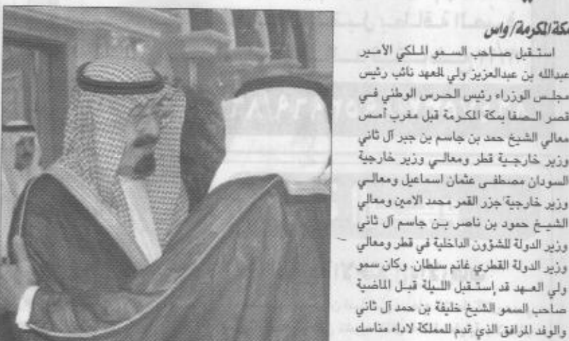
الامير عبدالله خلال استقباله الليلة قبل الماضية الشيخ خليفة بن حمد آل ثاني والوفد المرافق له

الف ووجه وقام بتوزيع الكثير من المستلزمات والاحتياجات المنزلية للمستحقين وما يزيد على ستة عشر الف حقيبة مدرسية للمحتاجين من الطلبة ولم تقتصر مساعدات المشروع على مدينة مكة المكرمة وحدها بل تعدتها الى المحتاجين في أكثر من اثنتي وأربعين قرية في محيط مكة المكرمة. وأشار الدكتور أحمد محمد علي الى أن صاحب السمو الملكي الأمير عبدالعزيز بن عبدالعزيز بولي هذا المشروع الخيري اهتمتاه كثيرا لما يسهل من حلقة متصلة في سلسلة أعمال البر والخير وزعامة خفيف الرحمن وسالم حسين الجعفري وعبدالله الفايز والشيخ صالح العسافي. وخلال الاستقبال قدم معالي الدكتور أحمد محمد علي رئيس البنك الاسلامي للتنمية عضو مجلس ادارة المستودع الخيري في مكة المكرمة في كلمة موجزة أمام سمو ولي العهد والضيوف نداء عن مشروع المستودع الخيري واهداه التي يعد تحقيقها أمثاماً لعمل الخير المتواصل في أبناء هذه النوايا وحبهم الشديد لخدمة شريف الرحمن من حجاج ومعتزمين والتساق والتنافس في رفاة الحج وسقياهم. وبين ان المستودع الخيري بمكة المكرمة قدم في اعام المنصرم خمسة ملايين وجبة على حجاج بيت الله الحرام والفقراء في مكة المكرمة يعمل يومي يزيد على خمسين