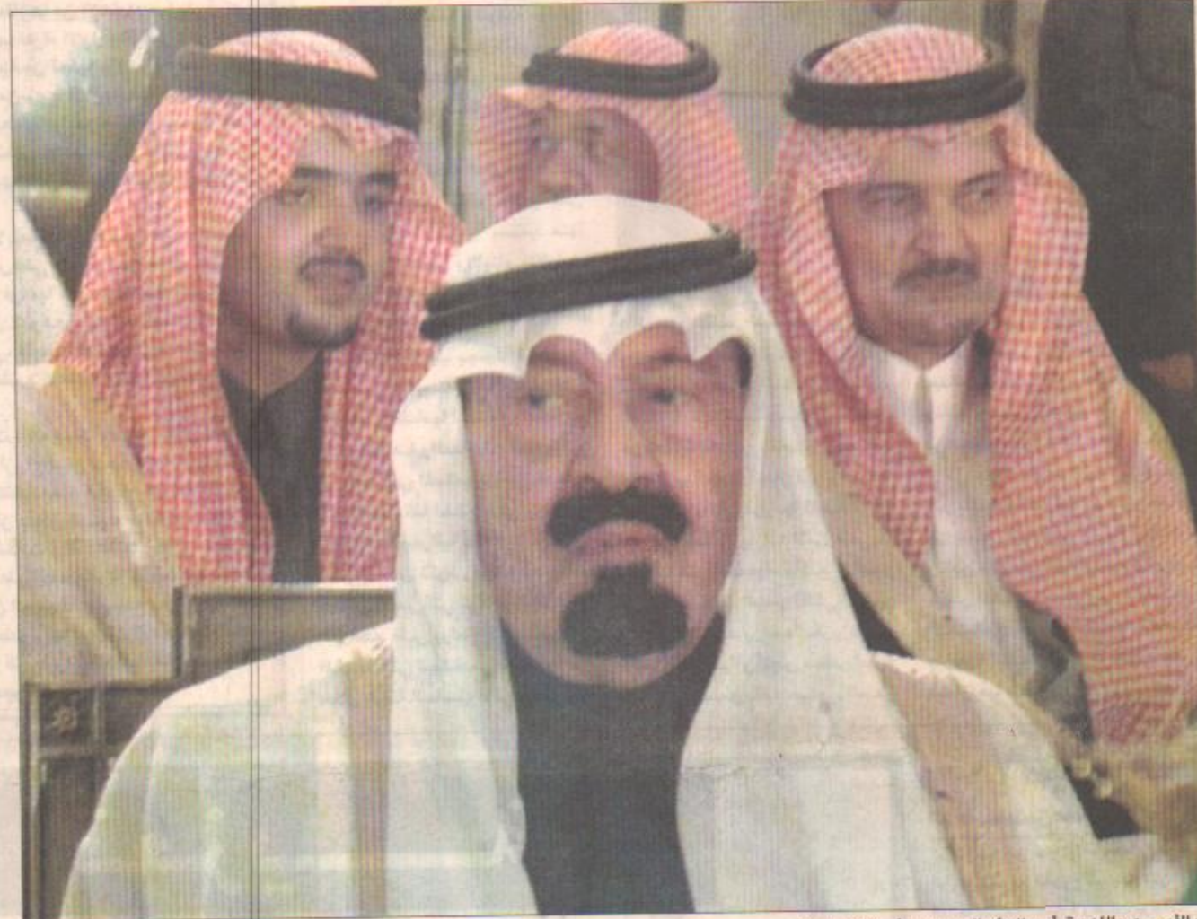
الأمير عبدالله يتفقد الرئيس السعودي في قمة بيروت

دعا سموه إسرائيل إلى ترك أسلوب القوة والقمع مؤكدا أنها إذا رضيت بالسلام الحقيقي فلن يتردد العرب في القول بحق الشعب الإسرائيلي أن يعيش في أمن مع شعوب المنطقة. وتناشد الأمير عبدالله جميع الدول الصديقة في كل مكان من العالم أن تتف بشفرة الإنسانية لدعم هذا التوجه الذي يستهدف إزاحة خطر الحرب المدمرة وتحقيق السلام لجميع شعوب المنطقة بلا استثناء.