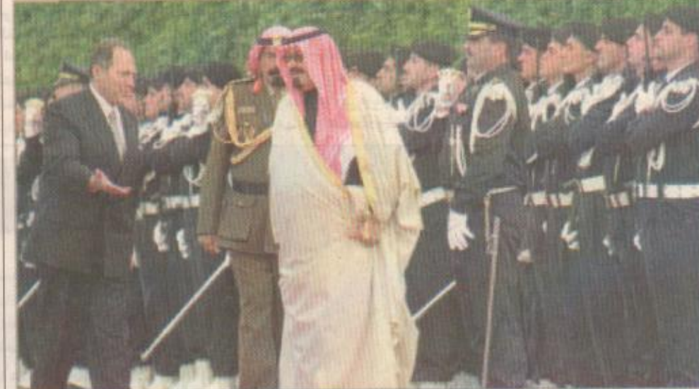
سمو ولي العهد والرئيس اللبناني يستعرضان حرس الشرف

لحدود نيابة عن اخيه خادم الحرمين الشريفين الملك فهد بن عبد العزيز ال سعود - حفلفه الله - قلادة الملك عبد العزيز وهي أعلى وسام في المملكة العربية السعودية يُمنح لأصحاب الجلالة والفخامة رؤساء الدول. وقد وصل في معية سمو ولي العهد وفد رسمي يضم صاحب السمو الملكي الامير بدر بن عبدالعزيز نائب رئيس الحرس الوطني وصاحب السمو الملكي الامير بن عبدالعزيز وصاحب السمو الملكي الامير سلمان بن عبدالعزيز أمير منطقة الرياض وصاحب السمو الملكي الامير سعود الفيصل وزير الخارجية وصاحب السمو الملكي الامير عبدالله بن عبدالعزيز أمير منطقة الجوف وصاحب السمو الملكي الامير عبدالمجيد بن عبدالعزيز أمير منطقة مكة المكرمة وصاحب السمو الامير فيصل بن عبدالله بن محمد المستشار بديوان سمو ولي العهد وصاحب السمو الملكي الامير عبدالعزيز بن عبدالله بن عبدالعزيز المستشار بديوان سمو ولي العهد وصاحب السمو الملكي الامير عبدالعزيز بن فهد بن عبدالعزيز وزير الدولة عضو مجلس الوزراء ورئيس ديوان رئاسة مجلس الوزراء وصاحب السمو الملكي الامير منصور بن عبدالله بن عبدالعزيز ومعالي وزير المالية والاقتصاد الوطني الدكتور ابراهيم العساف ومعالي رئيس ديوان سمو ولي العهد الاستاذ ناصر الراجي ومعالي المستشار بديوان سمو ولي العهد الاستاذ عبدالحسن