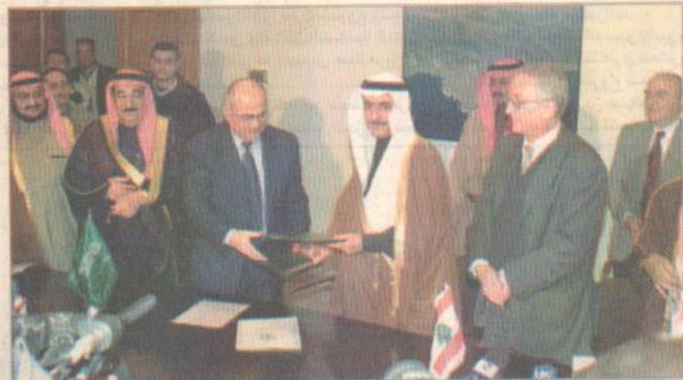
الجانبان السعودي واللبناني خلال توقيعهما مذكرة التفاهم

اضافي للبنان مقدار ٣٠ مليون دولار امريكي لمساعدة لبنان في بناء مشاريعه الحيوية المختلفة بما في ذلك قطاع الكهرباء الذي استهدفه الععدوان الاسرائيلي الاخير. ورد معالي وزير المالية اللبنانية جورج فرم بتقديم الشكر لخدمات الحرمين الشريفين الملك فهد بن عبدالعزيز ولصاحب السمو الملكي الامير عبدالله بن عبدالعزيز على هذه المبادرة الجديدة تجاه لبنان وشعبه مما يؤكد ان المملكة العربية السعودية تؤكد دائما الى جانب لبنان في المجالات كافة. من جهة وجه رئيس مجلس الانماء والاعمار اللبناني محمود عثمان خالص شكر وامتنان لبنان لخدمات الحرمين الشريفين الملك فهد بن عبدالعزيز ولي عهده الامين على الدعم المطلق الذي يوفرانه للبنان في المحافل الدولية. يشار الى انه بتوقيع هذه المذكرة يصبح التعاون الاقتصادي والمالي بين المملكة العربية السعودية ولبنان في مجالات التنمية والاعمار والاستثمار في مشاريع التنمية في مجالات الشرب ومجالات تربية. ولغت الى ان لبنان يعتبر من اكثر الدول استفادة من مساعدات الصندوق السعودي للتنمية اذ بلغت قيمة المشاريع التي مولها الصندوق في لبنان ما مقداره مليار ريال سعودي غطت معظم المناطق اللبنانية وشملت كافة القطاعات الانمائية. واعلن معالي وزير المالية ان صاحب السمو الملكي الامير عبدالله بن عبد العزيز وجه بتقديم دعم