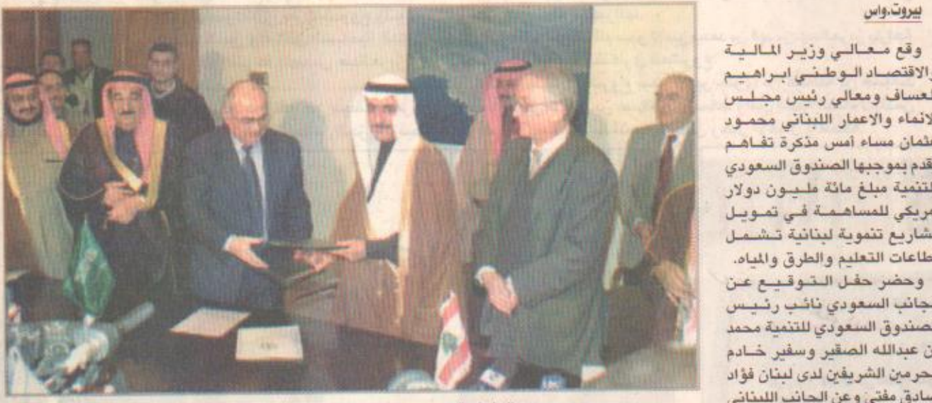
الجانبان السعودي واللبناني خلال توقيعهما مذكرة التفاهم

اضافي للبنان مقدار ٣٠ مليون دولار امريكي لمساعدة لبنان في بناء مشاريعه الحيوية المختلفة بما في ذلك قطاع الكهرباء الذي استهدفه العدوان الاسرائيلي الاخير. ورد معالي وزير المالية اللبنانية جورج فرم بتقديم الشكر لخدمات الحرمين الشريفين الملك فهد بن عبدالعزيز ولصاحب السمو الملكي الامير عبدالله بن عبدالعزيز على هذه المبادرة الجديدة تجاه لبنان وشعبه مما يؤكد ان المملكة العربية السعودية تفق دائما الى جانب لبنان في المجالات كافة. من جهة وجه رئيس مجلس الانماء والاعمار اللبناني محمود عثمان خالص شكر وامتنان لبنان لخدمات الحرمين الشريفين الملك فهد بن عبدالعزيز وولي عهده الامين على الدعم المطلق الذي يوفرانه للبنان في المحافل الدولية. يشار الى انه يتم توقيع هذه المذكرة يصبح التعاون الاقتصادي والمالي بين المملكة العربية السعودية وجمهورية لبنان الشقيق مبلغا مقداره حوالي اربعة مليارات ومائة وعشرة ملايين ريال سعودي اي ما يعادل حوالي مليار وستة وتسعون مليون دولار امريكي اضافة الى مبلغ ٥٠٠ مليون دولار امريكي قامت المملكة بإيداعه لدى البنك المركزي اللبناني بهدف دعم الليرة اللبنانية.