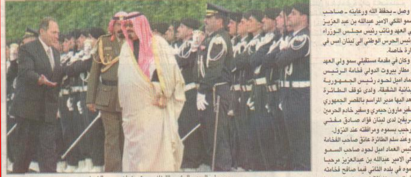
سمو ولي العهد والرئيس اللبناني يستعرضان حرس الشرف

لحدود نيابة عن اخيه خادم الحرمين الشريفين الملك فهد بن عبد العزيز ال سعود - حلفه الله - قلادة الملك عبد العزيز وهي أعلى وسام في المملكة العربية السعودية لمنح لأصحاب الجلالة والفخامة رؤساء الدول. وقد وصل في معية سمو ولي العهد وفد رسمي يضم صاحب السمو الملكي الامير بدر بن عبدالعزيز نائب رئيس الحرس الوطني وصاحب السمو الملكي الامير بن عبدالعزيز وصاحب السمو الملكي الامير سلمان بن عبدالعزيز أمير منطقة الرياض وصاحب السمو الملكي الامير سعود الفيصل وزير الخارجية وصاحب السمو الملكي الامير عبدالله بن عبدالعزيز أمير منطقة الجوف وصاحب السمو الملكي الامير عبدالمجيد بن عبدالعزيز أمير منطقة مكة المكرمة وصاحب السمو الامير فيصل بن عبدالله بن محمد المستشار بديوان سمو ولي العهد وصاحب السمو الملكي الامير سعود الفيصل وزير الخارجية وصاحب السمو الملكي الامير بن عبدالعزيز بن عبدالله بن عبدالعزيز المستشار بديوان سمو ولي العهد وصاحب السمو الملكي الامير عبدالعزيز بن فهد بن عبدالعزيز وزير الدولة عضو مجلس الوزراء ورئيس بديوان رئاسة مجلس الوزراء وصاحب السمو الملكي الامير منصور بن عبدالله بن عبدالعزيز ومعالي وزير المالية والاقتصاد الوطني الدكتور ابراهيم العساف ومعالي رئيس بديوان سمو ولي العهد الاستاذ ناصر الراجي ومعالي المستشار بديوان سمو ولي العهد الاستاذ عبدالحسن