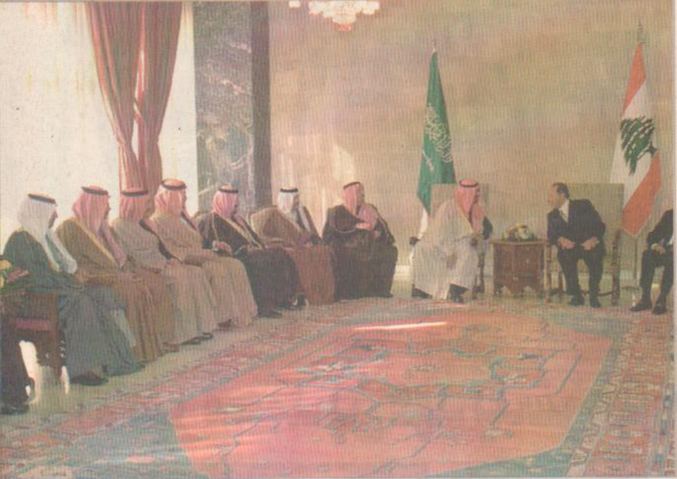
الأمير عبدالله والرئيس لحدود خلال لقائهما بالقرى الجمهوري