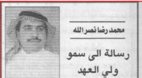
محمد رضا نصرالله رسالة الى سمو ولي العهد

الظهران/اليوم يبدن صاحب السمو الملكي الأمير عبدالله بن عبدالعزيز ولي العهد نائب رئيس مجلس الوزراء رئيس الحرس الوطني ظهر اليوم معمل غاز الحوية الذي ينتج نحو 1,4 بليون قدم مكعبة قياسية من الغاز في اليوم ويرفع امدادات الغاز في المملكة بما يزيد على 30 بالمائة. وقال عبدالله صالح بن جمعة رئيس شركة ارامكو السعودية كبير ادارييها التقنيين ان مشروع غاز الحوية يمثل فقرة عملاقة في مسار تم التخطيط له بدقة وبالغ لتلبية الطلب المتزايد بسرعة مطردة على الغاز في المملكة ويمثل برنامج الغاز في الحوية بما فيه من شبكة انابيب مترابطة ومعامل للمعالجة وشبكة للتوزيع رمزاً للابتكار وكفاءة الاداء والخبرة السعودية التي تنفذها ارامكو السعودية.