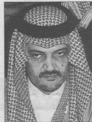
الأمير سعود الفيصل

أكد صاحب السمو الملكي الأمير سعود الفيصل وزير الخارجية أن الزيارة التي يقوم بها صاحب السمو الملكي الأمير عبدالله بن عبدالعزيز في العهد ونائب رئيس مجلس الوزراء ورئيس الحرس الوطني إلى جمهورية جنوب أفريقيا حالياً اكتسبت أهمية خاصة كونها تأتي لتقوية العلاقة مع هذا البلد الشقيق الذي يشهد فيه تقوية العلاقات بين المملكة العربية السعودية وجمهورية جنوب أفريقيا منذ توقيعها وتوافقاً في الرأي بين الوزراء ونائب رئيس مجلس جمهورية جنوب أفريقيا حالياً كما أن اللقاء يفتح آفاقاً جديدة للتعاون في مختلف المجالات الاقتصادية والتجارية والقيمية. أكد سمو وزير الخارجية أن هناك توافقاً في الرؤى السياسية بين البلدين حول دفع مسيرة التعاون الثنائي لما فيه مصلحة الشعبين. وأشار سمو إلى الإنجاز السياسي الذي حققته المملكة العربية السعودية بقيادة خادم الحرمين الشريفين الملك فهد بن عبدالعزيز آل سعود وسمو ولي عهده الأمين وجمهورية جنوب أفريقيا بقيادة فخامة الرئيس نيلسون مانديلا بشأن قضية لوكرجي. وقال سمو: «إن هذا اللقاء على الامكانات المتاحة للبلدين للدخول حتى على عقد الشكليات». وأضاف سمو: «إن المملكة العربية السعودية كانت من أوائل الدول التي أقامت علاقات مع جمهورية جنوب أفريقيا التي تمت بشكل مضطرب وتحوّلت خلال السنوات الخمس الماضية من مجرد تعاون دبلوماسي إلى التموح الآن إلى تعاون استراتيجي بين البلدين».