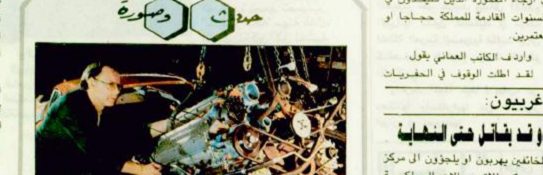
تونس - مكتب الجزيرة - الطبيب فراد

وصف سيد احمد غزالي وزير الخارجية الجزائري نتائج قمة قادة دول اتحاد المغرب العربي التي اختتمت اول امس في الجزائر بانها ايجابية واعطت دفعا جديدا لتجسيد الاتحاد واضاف في مؤتمر صحفي عقده الليلة الماضية بوصفه الناطق الرسمي للقمة طبقا لـ « لينا » ان الاتفاق الذي تم في ميدان الوحدة الجمركية يعتبر اتفاقا تاريخيا بجاء تعبيراً عن الارادة الحقيقية في تجسيد الوحدة المغاربية مشيراً الى ان العمل المنجز في إطار الوحدة الجمركية يبرز ارادة مواصلة الجهود للوصول الى ازالة الحدود بين البلدان المغاربية وتشبيد مغرب بلا حدود