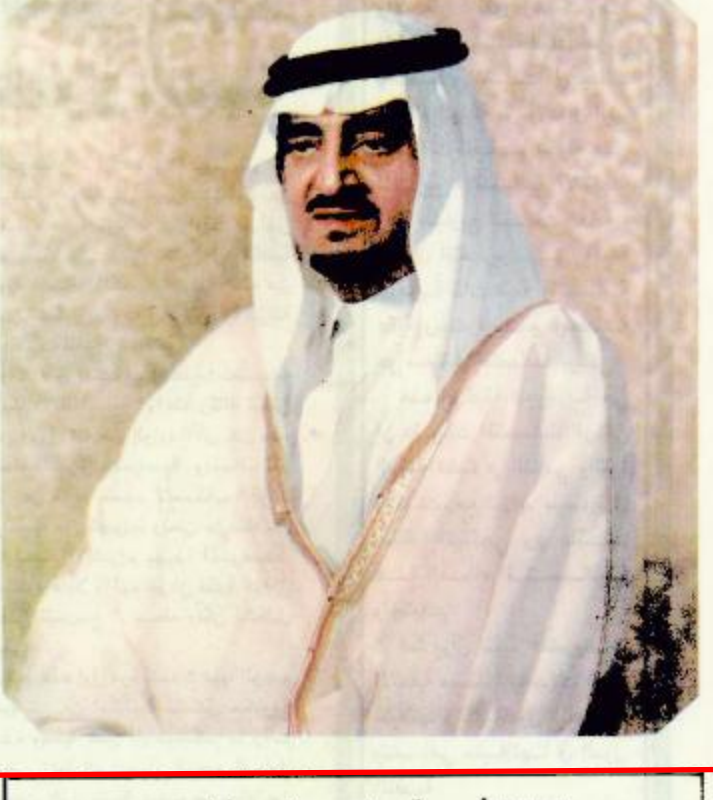
في برقيتين بعث بها امس خادم الحرمين الشريفين يهنئ سلطان عمان بذكرى الجلوس والرئيس المصري بليوم الوطني

وقال معالي بان هذه التوجيهات هي بمثابة المؤثر الحقيقي لجميع اعمالنا وتصرفاتنا حيال خدمة ضيوف الرحمن ونسعى جاهدين لوضع هذه التوجيهات السامية موضع التنفيذ. واشار معالي في حديث له للجزيرة الى الاستعدادات لحج هذا العام قائلاً: ان اي وفد كريم يلمس بنفسه ما قدمته له الدولة من خدمات في كل شبر من الارض التي تخطوها قدماء من جسور وانفاق ومطلات وطرق معبودة سهلة وتشجير ومرافق عامة على المستوى الكبير الذي يبراز منه خدمة الحجاج وضياف معاليه بان حكومة خادم الحرمين الشريفين اعتمدت بتفويض كافة المشروعات الحيوية التي يعود مردودها بالخير على ضيوف المملكة من الحجاج وترتكز الاهتمام على اجراء توسعات داخلية وخارجية للصومين الشريفين ومنها استكمال الدور الثالث للحرم المكي الشريف واستيمايه والشركات الاخرى من الحجيج وكذلك بالنسبة للحرم النبوي الشريف ومسجد قباء وعشرات المساجد الاخرى ومنها مساجد الرماح التي تم تحسينها وتجهيزها بكامل المرافق العامة.