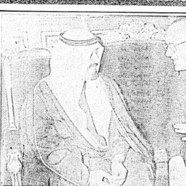
حديث باسم سمو الامير عبدالله بن عبدالعزيز وسمو ولي العهد

المسلمون والحضارات ايها الصديق العزيز.. لقد تحدثت عن اول سفارة بين الغرب المسيحي والشرق الاسلامي في القرنين التاسع عشر والتاسع عشر. وقد اشترمت الى الاحتكاك والصدام والمواجهة بين حضارة الغرب المسيحي وحضارة الشرق المسلم ولكنك لا شك تعلم ايها الصديق العزيز ان الحضارات اسلوبا خاصا بها في التصاور والحوار