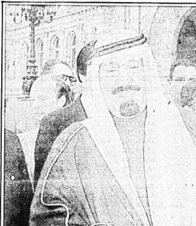
سمو ولي العهد والسيد جاك شيراك

ولعل ابرز مظاهر ذلك الاسلوب الصدامي والمواجهة واحيانا الصرب والمقاومة وحتى الحرب هي اسلوب حوار بين الحضارات ولا خلاف ان الحوار بين الشرق والمسلم والغرب المسيحي لم يسفر فقط عن تدخل ثقافات بل اسفر ايضا عن احياء ثقافات كالثقافة الاغريقية التي نفض عنها المسلمون والعرب تراب القرون واننا ان نسينا فلن نسي تلك الجامعات التي انشأها العرب في اسبانيا فكانت بمثابة بؤبؤ من نور في دجلة ليل واننا لا شك نذكر ان البعض مما تربع على كرسى السيادة قد تخرج من تلك الجامعات اما فيما يتعلق بموقف المسيحية واليهودية معا فلقد حدهه نبي الاسلام يقول (من اذى ذميا فقد اذني).