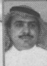
محمد رضا نصر الله