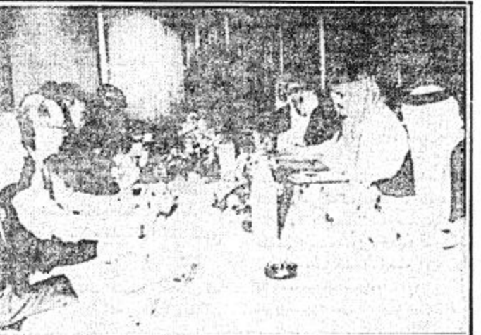
الجلسة الثانية من المباحثات السعودية - الكندية

مساعي الملكة الخيرة رافد لتحقيق التكامل والتضامن الإسلامي