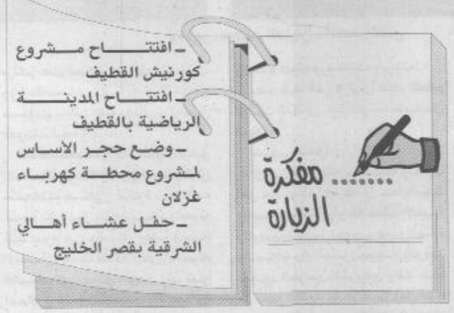
افتتاح مشروع كورنيش القطيف - افتتاح المدينة الرياضية بالقطيف - وضع حجر الأساس لمشروع محطة كهرباء غزلان - حفل عشاء اهالي الشرقية بقصر الخليج

حفل عشاء لاهالي المنطقة الشرقية بالديوان الملكي بقصر الخليج. ويهذه المناسبة الى معالي وزير الصناعة والكهرباء د. هاشم بن عبدالله يسماني بتصريح حيا فيه مقدم سمو ولي العهد لهذا الجزء من ارض الوطن وشكر لسموه الكريم نظله برعاية الحفل المقام وأضاف د. يسماني ان هذا المشروع يعد من أضخم المشاريع التي تمثل العمود الفقري للنظام الكهربائي في المملكة ويسأتي ضمن الخطة الكهربائية طويلة الأمد الهادفة لمواجهة النمو