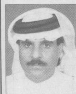
بقلم / فهد بن سعد البلوي