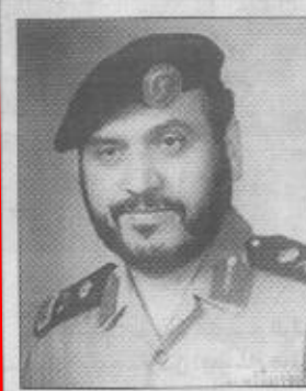
بقلم اللواء / محمد بن صالح العصيمي

يترامن الوقت الذي يتطلع فيه أبناء المنطقة الشرقية للقاء صاحب السمو الملكي ولي العهد نائب رئيس مجلس الوزراء ورئيس الحرس الوطني مع الحدث الذي توجت فيه البلاد احتفالاً بمرور ١٠٠ سنة على تأسيسها وبموتىة الخير والبناء والتوحيد والتماء.