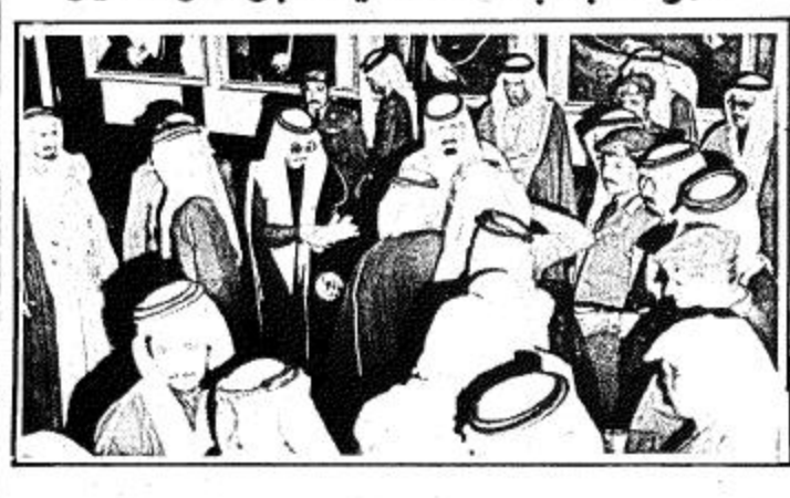
الرئيس - واس - استقبل صاحب السمو الملكي الامير عبد الله بن عبد العزيز نائب جلالته الملك محمد بن سعود بن عبدالعزيز آل سعود في قصر سموه في الرياض امس صباح امس جموعا من المواطنين الذين قدموا للسلام على سموه.

سوا نانب جلالة الملك يستقبل المواطنين الرئيس - واس - استقبل صاحب السمو الملكي الامير عبد الله بن عبد العزيز نائب جلالته الملك محمد بن سعود بن عبدالعزيز آل سعود في قصر سموه في الرياض امس صباح امس جموعا من المواطنين الذين قدموا للسلام على سموه. في راحة فلاحية - سياحية الملك حسين يغادر أمس الى الولايات المتحدة وذكر ان العاهل الاردني سيجري فحوصات طبية في احد المراكز الاسريكية المتخصصة خلال زيارته للولايات المتحدة. وكان العاهل الاردني قد اضطل احد المستشفيات الاردنية قبل اسبوعين لاصابة بقرحة ثاوية. هذا وقد ذكر مصدر مطلع في العاصمة الاردنية ان العاهل الاردني سيتوجه لواشنطن لاجراء عمليات سياسية مع الاستاذين لاجراء عمليات سياسية مع الاستاذين من مدينين ومسكرين.