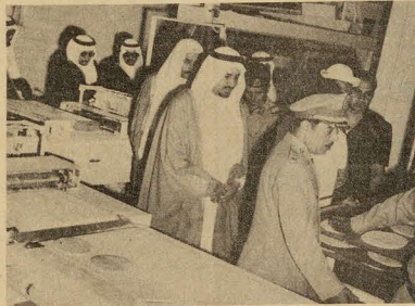
جلالته يتفقد منشآت مدينة الملك فيصل