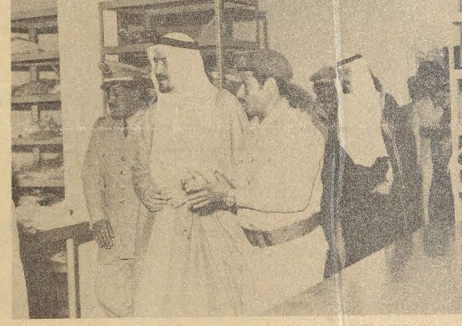
جلالته يتفقد بعض منشآت مستشفى المدينة العسكرية