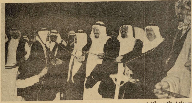
جلالته وأصحاب السمو الملكي الأمراء في احتفالات عسير