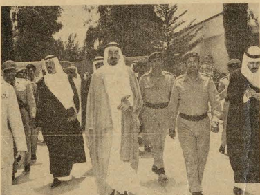
جلالته أثناء جولته في المدينة العسكرية