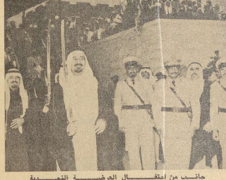
جائت من استقبال العرضة الفجسية

لقد كانت هذه الزيارة في ختام زيارة جلالته لمنطقة عسير تحبيراً وتأكيداً لدور فوائنا المسلحة الجيدة واعزازاً وتقديراً بما تقوم به في خدمة قضائنا القومية والاسلامية .