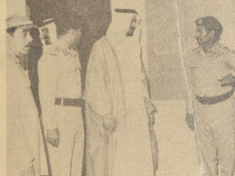
جلالته داخل صالات المستشفى العسكري