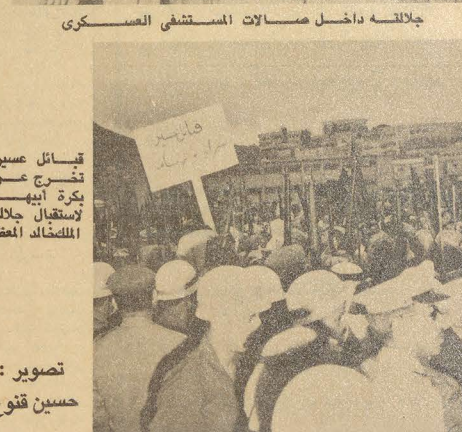
تقبائل عسير تخرج عن بكرة ابيها لاستقبال جلالته الملكخالد المعظم