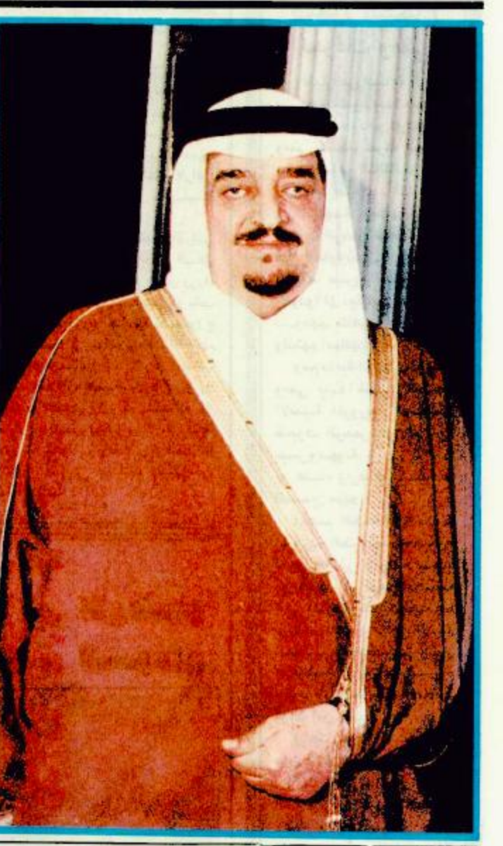
في برقية لجلالته رفقاً وزير الأوقاف: رئيس بعثة حج الجمهورية العربية اليمنية يشيد بالتطور الكبير بالمشاعر المقدسة

وقال معالي وزير الحج والإرشاد الإسلامي الشيخ محمد صالح المنجد: «تبدأ في الساعة الرابعة من عصر اليوم حركة صعود الحجاج إلى عرفات ومنى. وهي جزء من خطة من الحج التي وضعت موضع التنفيذ منذ الأسبوع الماضي بعد أن أقرها صاحب السمو الملكي الأمير نايف بن عبدالعزيز وزير الداخلية في اجتماع لسوء بقيادة فوات من الحج الأسبوع الماضي ومن ناحية أخرى أصبحت جميع مرافق خدمات الدولة للحجّاج على أهبة الاستعداد لآداء واجباتها لخدمة صفوف الحجاج حتى يوفوا مناسك حجهم بسير وسهولة، وإمن وطمانينة وخلال استقبال خادم الحرمين الشريفين، جلالة الملك فهد بن عبدالعزيز المعزى رؤساء بعثة الحج الإسلامية وتكبير الشخصيات الإسلامية التي قدمت إلى الأراضي المقدسة لآداء فريضة الحج هذا العام أعرب الجميع لثقلته عن أئذنتهم المألوفة بما سألوه من مستودعات