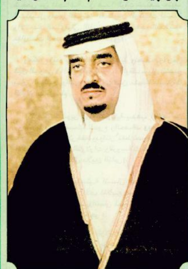
الرياض - واس. تلقى جلالة اللك فهد بن عبدالعزيز المفدى برقية شكر جوابية من حاكم عام أستراليا أن سام استيفن ردا على البرقية التي كان جلالته قد بعث بها اليه بمناسبة اليوم الوطني لبلاده وقد اعرب حاكم عام استراليا باسمه وياسم شعب استراليا عن خالص شكره لجلالة