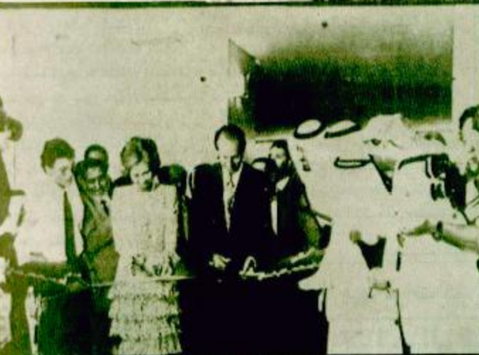
مدريد - / جاسر الجاسر - واس. فهد بن عبد العزيز آل سعود - يحفظه بتكليف من خادم الحرمين الشريفين الملك

سموه: خادم الحرمين الشريفين أراد لهذا المركز أن يكون شعلة إشعاع يعم نورها الجميع الملك كارلوس: هذا يوم رائع للمسلمين في اسبانيا والمركز سيثري عاصمتنا الجميلة