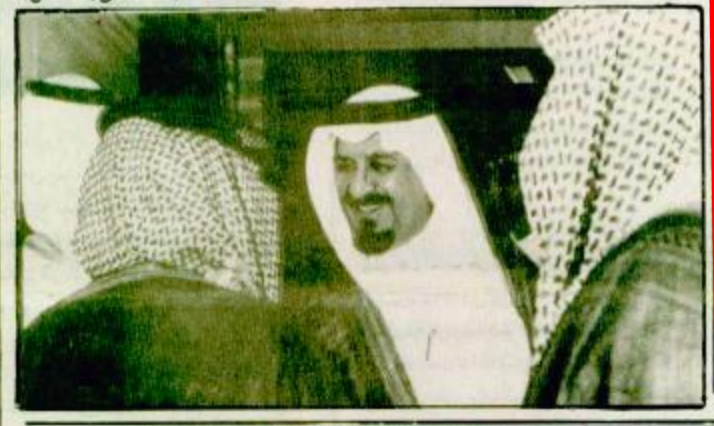
الرياض / جاسر الجاسر - واس. فهد بن عبد العزيز آل سعود - يحفظه بتكليف من خادم الحرمين الشريفين الملك

الرياض / عوض مانع الفحطال. تحت رعاية صاحب السمو الملكي الأمير سلطان بن عبد العزيز النائب الثاني لرئيس مجلس الوزراء وزير الدفاع والطيران والمفتش العام، تحفل كلية الملك فيصل الجوية بتخريج الدورة (٤٢) من طلبة الكلية. أعلن ذلك أمس قائد كلية الملك فيصل الجوية اللواء الأمير محمد بن عبد الله بن محمد وعرب سموه عن اعتزازه ومنسوبي الكلية برعاية سمو النائب الثاني ومشاركته أبناء الطلبة الطيارين والقيدين. وقال أن سموه يحضر على أن يكون بين أحواله منسوبي القوات المسلحة في مختلف القطاعات وأعرب قائد كلية الملك فيصل الجوية عن سعاده وتفانك بتزامن حفل تخريج الدورة ٤٢ مع ذكرى اليوم الوطني للمملكة (البرقية ص ٣٦) (التفاصيل بالداخل)