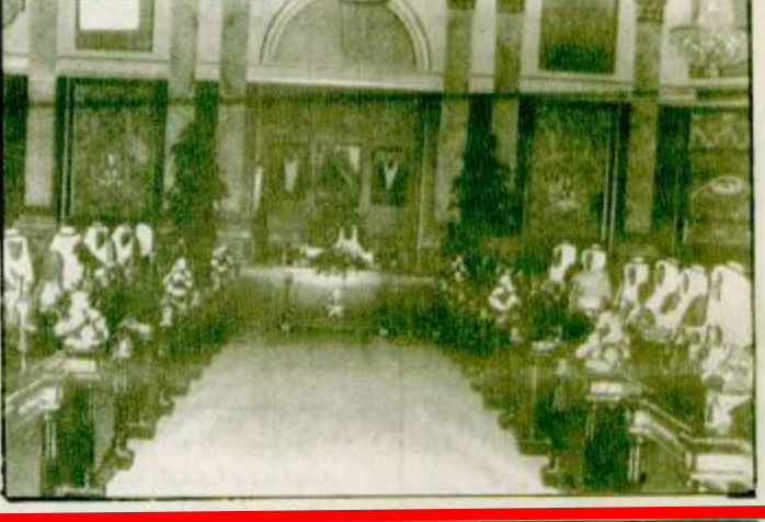
الرياض / جاسر الجاسر - واس. فهد بن عبد العزيز آل سعود - يحفظه بتكليف من خادم الحرمين الشريفين الملك

نمط المعدل السريع الذي تحققت به إنجازاتها التنموية والحضارية يثير الدهشة والإعجاب