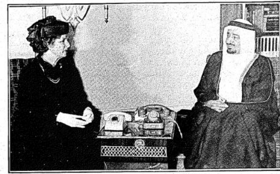
جلالة الملك لدى استقباله السيدة تاتشر