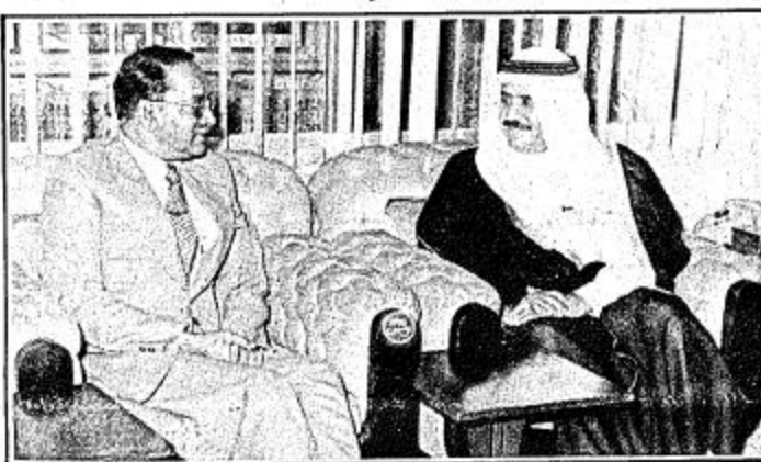
دارت مباحثات امنية بنن الملكة وجمهورية بنغلاديش نوقشت فيها سبل التعاون والعلاقات الثنائية بين البلدين في هذا المجال وامكانيات تطويرها في الاجتماع الذي عقده ظهر امس صاحب السمو الملكي الأمير نايف بن عبدالعزيز

□ سمو الامير نايف لدى اجتماعه بوزير داخلية بنجلاديش □ الرحمن وزير الداخلية البنغالي الذي