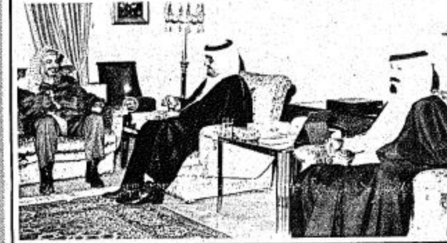
السيد ياسر عرفات مع الأمير فهد ووزير الدفاع البريطاني

خلال الأسابيع المقبلة، وأشار المراقبون ان ان فلان دير كلاب سيق ان زار عمان ويغادر دمشق... واجتمع ايضا باين عام جامعة الدول العربية، وتضمن البيان ان المجلس الأوربي احيط علما بتقرير مؤلف قدمه فلان دير كلاب الرئيس الحالي للمجلس الأوربي حول النتائج الأولى للهمة التي يقوم بها في الوقت الحالي في الشرق الأوسط باسم الدول العشر على اساس بيان البنقلية الصادر في ١٢ يونيو ١٩٨٠ وبين لويسبورج الصادر في ٢ ديسمبر ١٩٨٠