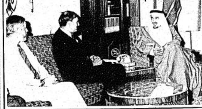
جلالته الملك أثناء استقباله نائب رئيس الوزراء الأسترالي