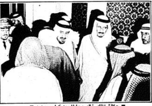
جلالة الملك خالد محافظاً بين كبار موعديه