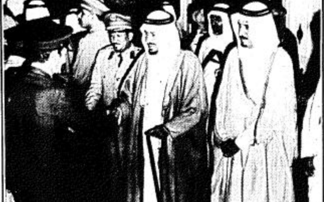
جلالته يصالغ احد كبار الضباط

وصل جلالته الملك خالد بن عبدالعزيز المدي الى مطار الملك عبدالعزيز الدولي في جدة في الساعة الثامنة الا ربعا من مساء امس بحفاوة ووعايتها قادمنا من الرياض وكان في استقبال جلالته في المطار صاحب السمو الملكي الامير فهد بن عبدالعزيز ولي العهد نائب رئيس مجلس الوزراء وصاحب السمو الملكي الامير ماجد بن عبدالعزيز امير منطقة مكة المكرمة كما كان في استقبال جلالته البقية من ٢٢