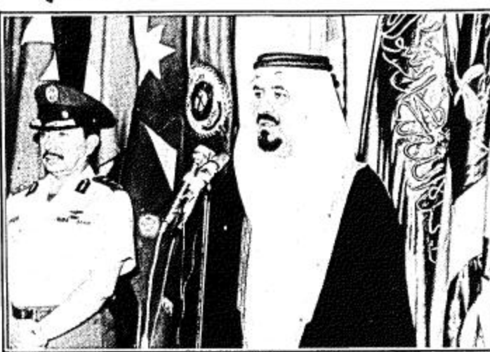
الأمير سلطان يلقي كلمته

قال صاحب السمو الملكي الأمير سلطان بن عبدالعزيز وزير الدفاع والطيران: أننا تألمنا للعدوان الذي حصل على المفاعل النووي العراقي، ولكننا كنا فخورين لأن العراق الشقيق لم يهنز وكان صامداً ثابتاً لخدمة وطنه وعروبته. جاء هذا في كلمة القاها سموه في حفل تخريج الدفعة الثامنة من كلية القيادة والأركان صباح امس. واضاف سمو الأمير سلطان: اننا لم تكن متأسفين على ما حصل لأن هذا يعطينا الدرس لاجد القوة الرادعة، واولها قوة الايمان بالله سبحانه وتعالى، ثم بقوة السلاح الحديث المتطور والرجل الحديث المتطور. وحول مجلس التعاون الخليجي قال سمو الأمير سلطان: انه في الوقت الذي وقعت فيه وثيقة المجلس من اصحاب الجلالة والسمو انطلاقاً لخدمة الاسلام والعروبة خرج من قول ملأنا لم تكون وحدة اندماجية او اتحاداً فيدرالياً او ما يشبه ذلك.. لقد تبين من هذه الكلمات، ولقد كانت هذه الكلمات معجزة امام الشعوب لأنها لم تحقق شيئاً او عملاً يساعده الشعوب في دينها ودينها واستقرارها وامانها. هذا واعان سمو وزير الدفاع والطيران انه سيدأ العمل بعد اسبوعين في بناء مبنى كلية القيادة والأركان بناء على اوامر من صاحب الجلالة الملك خالد المعظم وسمو ولي العهد.