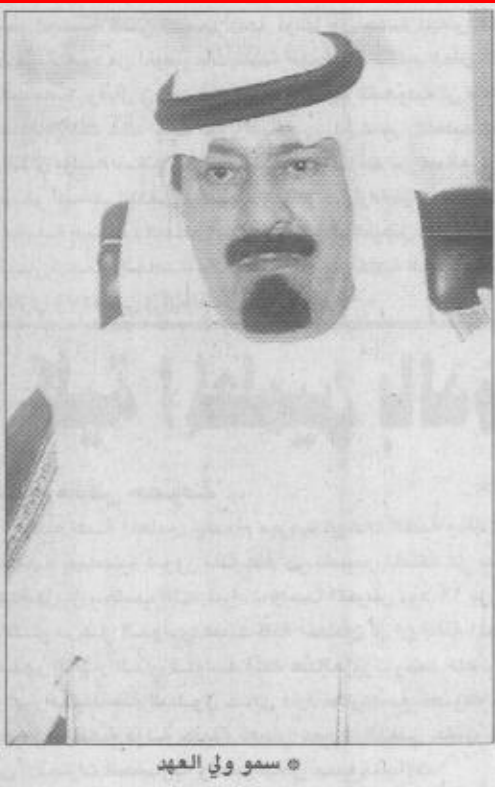
سمو ولي العهد