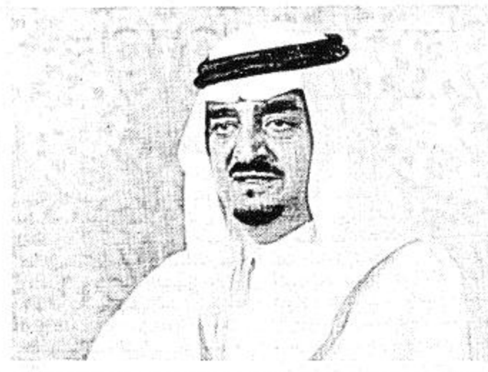
خادم الحرمين الشريفين يهنئ الرئيس الصومالي

تونس - مكتب الجزيرة - من الطيب فراد خصص الدكتور كرم نشأت إبراهيم الأمين العام لمجلس وزراء الداخلية العرب مندوب الجزيرة بتصريح أشاد فيه بما تقوم به الملكة بقيادة خادم الحرمين الشريفين من جهود قيمة واسعة لجمع شمل الأمة العربية وتوحيدها ووقوفها بقوة وحزم إزاء التحديات التي تواجهها إلى جانب المساعدات الأخوية السخية التي تقدمها الملكة إلى العديد من الدول العربية والإسلامية وبعض الدول الصديقة التي هي محل تقدير وإكبار الجميع فضلا على ما توفره الملكة من دعم مادي ومعنوي كبير لجميع أجهزة العمل العربي المشترك وأضفاء بريق هذا المجال بسعدني الأضواء بالدور البارز لحكومة الملكة في قيام مجلس وزراء الداخلية العرب وعلى وجه الخصوص الجهود القارصة القيمة التي بذلتها في هذا الشأن صاحب السمو الملكي الأمير نايف بن عبد العزيز من خلال رئاسته للمؤتمر الثالث لوزراء الداخلية العرب المنعقد في الطائف عام ١٩٨٠ الذي قرر إنشاء المجلس ورئاسته للمؤتمر الطارئ لوزراء الداخلية العرب المنعقد في الرياض في فبراير ١٩٨٢ الذي (البلقية ص ٢)