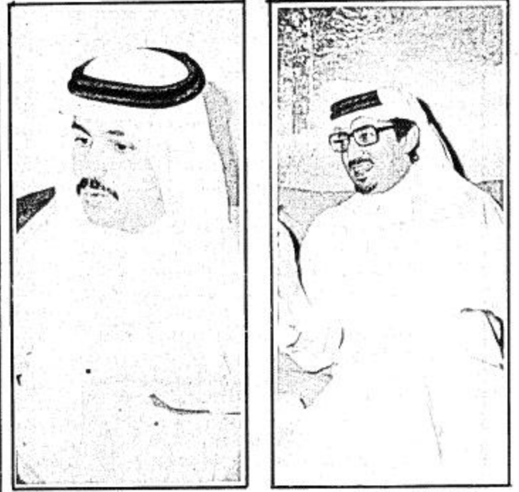
سمو الأمير خالد الفيصل □ سمو الأمير فيصل بن بندر □