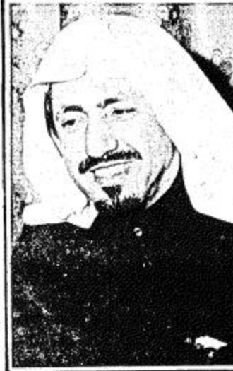
عمر الرشيد □ المتكاملة بطالبات المدارس التابعة للإدارة ويعمل بهذه الوحدة طاقم

مكتمل من الأطباء والمرضين والصيادلة والسائقين والخدم الذين لا يألون جهداً في تقديم إيسر الخدمات وأفضلها لطالبات المدارس وفي أي موقع من مواقع التعليم المنتشر في أرجاء المنطقة . ويعد أن رأت الرئاسة ممثلة في مسؤوليها أن الحاجة باتت ملحة لإنشاء إدارة لتعليم البنات بمنطقة بيشة للإشراف على المدارس المتواجدة بالمنطقة لا سيما أنه سيقومها مندوبيات كل من سبت العلاية والبشائر التي تخدم منطقة خشم وشمران وعليان وقد تم ذلك مع بداية العام الدراسي ١٤٠٣/١٤٠٤ هـ حيث صدر قرار معالي الرئيس العام لتعليم البنات بإنشاء هذه الإدارة .