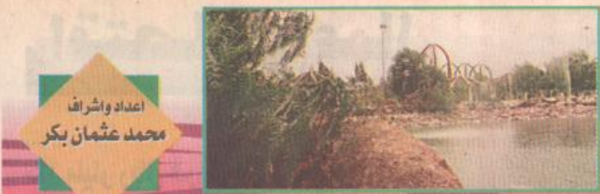
اعداد وشراف محمد عثمان بكر