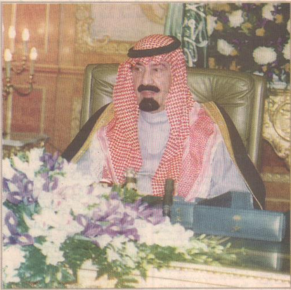
الأمير عبدالله بن عبدالعزيز

التعليم الجامعي بمحافظة الطائف وهي اهداء قصور الملك سعود بمرحمة بالحوية لتكون مقرا دائما لفرع جامعة أم القرى بالطائف والذي بدأ العمل في ترميم المباني وانتهاء التصاميم للمباني الجديدة. ونوه معاليه بالمشروع الضخم الذي يقدر بثمن والذي يفتخر به سمو الأمير عبدالله بن عبدالعزيز وولي العهد ورئيس مجلس الوزراء ورئيس الحرس الوطني بوضع حجر الأساس لمستشفى الطائف التخصصي بسعة أكثر من خمسمائة سرير وتكلفة تربو عن ٦٥٠ مليون ريال. كما تفصل سموه في زيارة عمه الماضي أيضا بإطلاق التبرعات التي ينفقها سموه في خدمة أهالي الطائف ولتأهيل كوادرهم في مختلف المجالات. كما تفصل سموه في زيارة عمه الماضي أيضا بإطلاق التبرعات التي ينفقها سموه في خدمة أهالي الطائف ولتأهيل كوادرهم في مختلف المجالات.