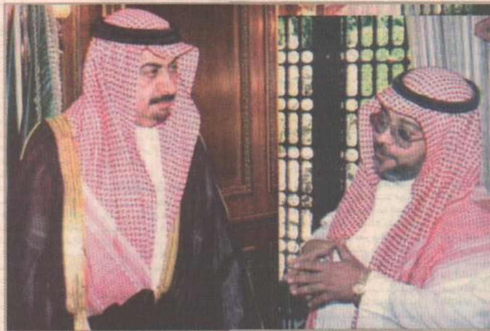
معالي المحافظ يتحدث للحضر

الكبرى والمتنوعة في هذا العهد السعودي الزاهر. فالحفل الذي تقيمه المحافظة والأهالي ما هو إلا تعبير صادق عن مدى ما يكتونه من حب وولاء لولاة خدام الحرمين الشريفين ولسموه الكريم الذي عودنا على رعايته واهتمامه بحفظه الله بكل ما يهم المواطن ويعزز الوطن نقاداً للتوجهات السلبية ولتقديم الخدمات الشريفة - يحفظه الله - كما أن افتتاح سموه الكريم للمتنزه الوطني بالطائف يتيح للمواطنين والمصافين من داخل المملكة ومن دول مجلس التعاون الخليجي الاستفادة من رافد من أهم الروافد السياحية في المحافظة. وقال معاليه: كما ان نفقة سموه مشروع الطريق السياحي الذي تنفذه بلدية الطائف لربط الطريق الدائري بالشارع عبر المتنزهات البرية من الوهيط والخرزان والمادين