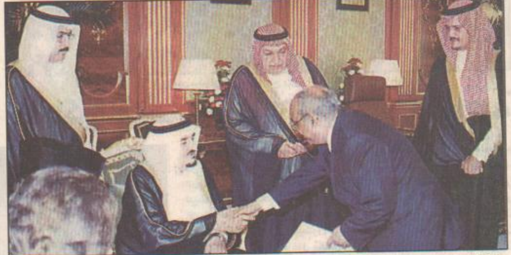
جدة/واس تسلم خادم الحرمين الشريفين الملك فهد ابن عبدالعزيز آل سعود في مكتبه بقصر السلام أمس أوراق اعتماد عدد من سفراء الدول العربية والإسلامية والصديقة سفراء معتمدين لبلدانهم لدى المملكة العربية السعودية. فقد تسلم - حفظه الله - أوراق اعتماد كل من: سفير جمهورية اندونيسيا بحر الدين لوبا وسفير جمهورية البرتغال جورج راؤول داسيلفا بريزو وسفير جمهورية الفلبين رفائيل سيسيس فاجريا وسفير الجمهورية التونسية عز الدين «التيقية» من ٢٠٠٠.