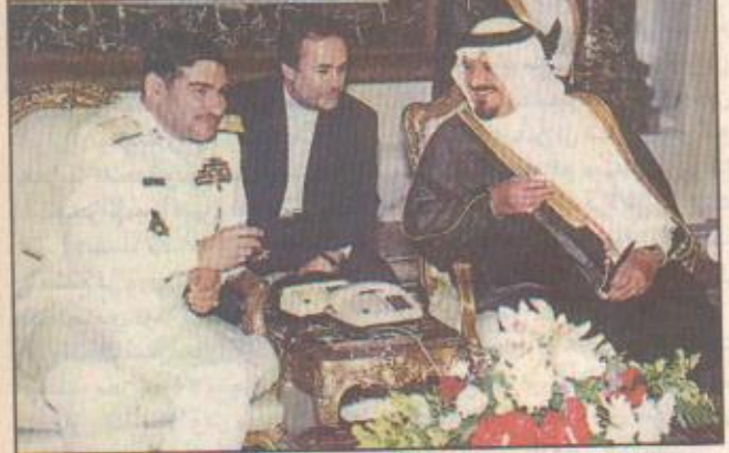
سمو النائب الثاني أثناء لقائه مع شمخاني (أ ب) بين المملكة العربية السعودية وجمهورية إيران الإسلامية قائمته سلطان بن عبدالعزيز النائب الثاني رئيس مجلس الوزراء وزير الدفاع والطيران والمفتش العام أن العلاقات «التيقية» من ٢٠٠٠، طالع ص ٤٠٢.

شمخاني يؤكد حرص إيران على تقوية علاقاتها العربية الأمير سلطان: لا تفكير في وجود أي تحزبات إقليمية