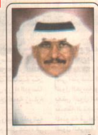
بقلم: محمد عبدالله الوعيل

في حديث المسؤولية الصادقة بين سمو ولي العهد الامين وبعض رجالات الجالية العربية والاسلامية في امريكا الذي تم ظهر امس يلمس الانسان العربي والاسلامي صدق التوجه السعودي واهتمام قيادته منذ تأسيس هذا الكيان على يد المغفور له الملك عبدالعزيز حتى العهد الميمون الذي نعيشه لخدام الحرمين الشريفين - حفظه الله - يلمس هذا الانسان بان القيادة السعودية واضحة وصادقة لخدمة الاسلام والمسلمين في جميع انحاء العالم، وقد لسن سمو الامير اثناء حواراه مع هؤلاء الكثير من القضايا التي تهم الانسانية، وقد الملح سموه في خطابه الي الكثير من الامور التي تسعى قيادتنا الرشيدة بتوجيه من خادم الحرمين الشريفين برعاية كثير من الامور التي تهم الانسانية وتهم الانسان العربي المسلم بصفة خاصة.