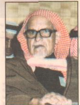
الشيخ حمد الجاسر