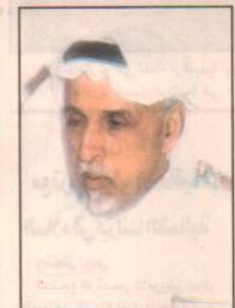
الشيخ محمد الجاسر