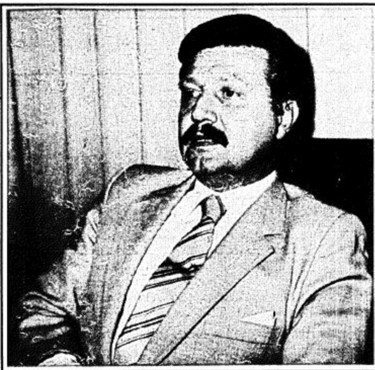
علاقتنا مع المملكة قديمة وتاريخية