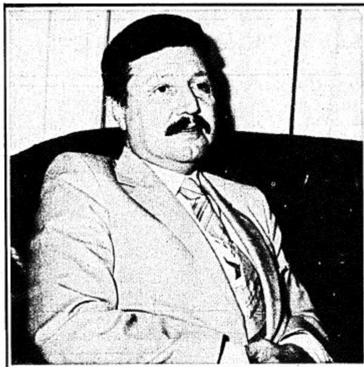
مشاريع مشتركة بين المملكة وتركيا