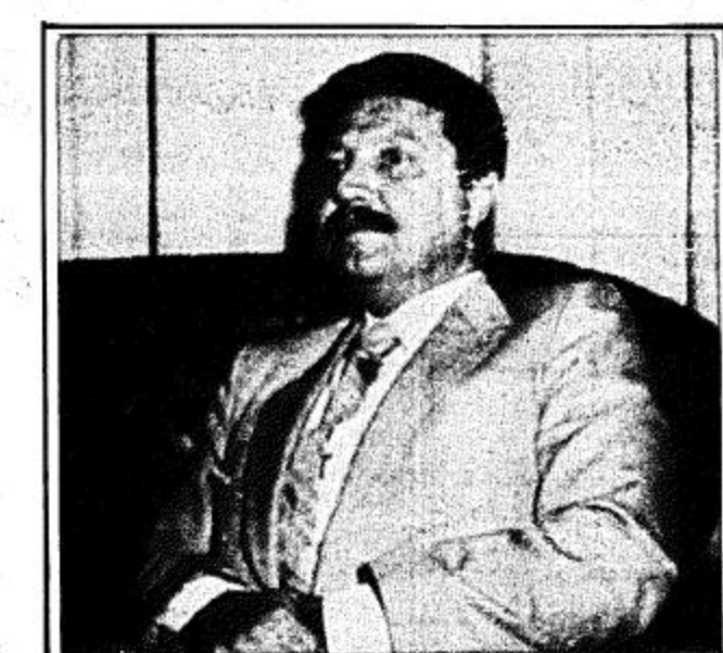
عبد كعير من المواطنين السعوديين زاروا تركيا