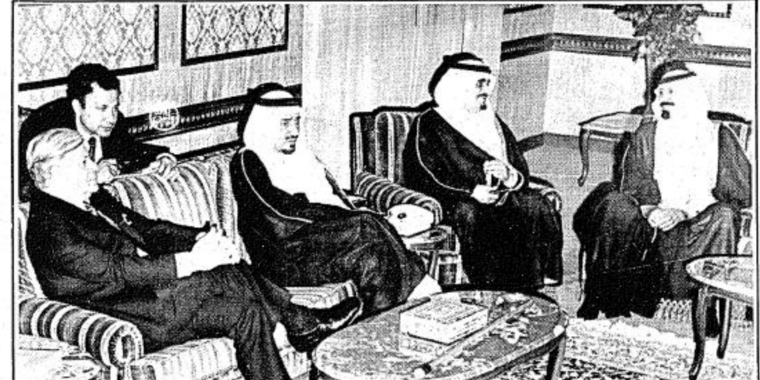
جانب من الاجتماع بين الملك خالد وشميدت بحضور الفهد وعبدالله