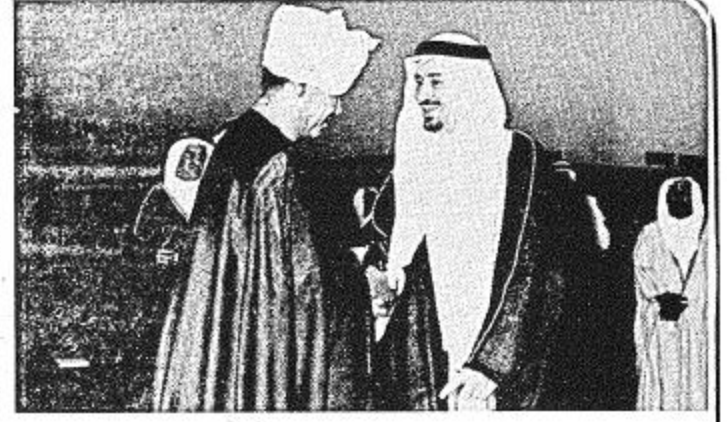
••• أربع لقطات من زيارة الرئيس نيكسون بالرياض •••