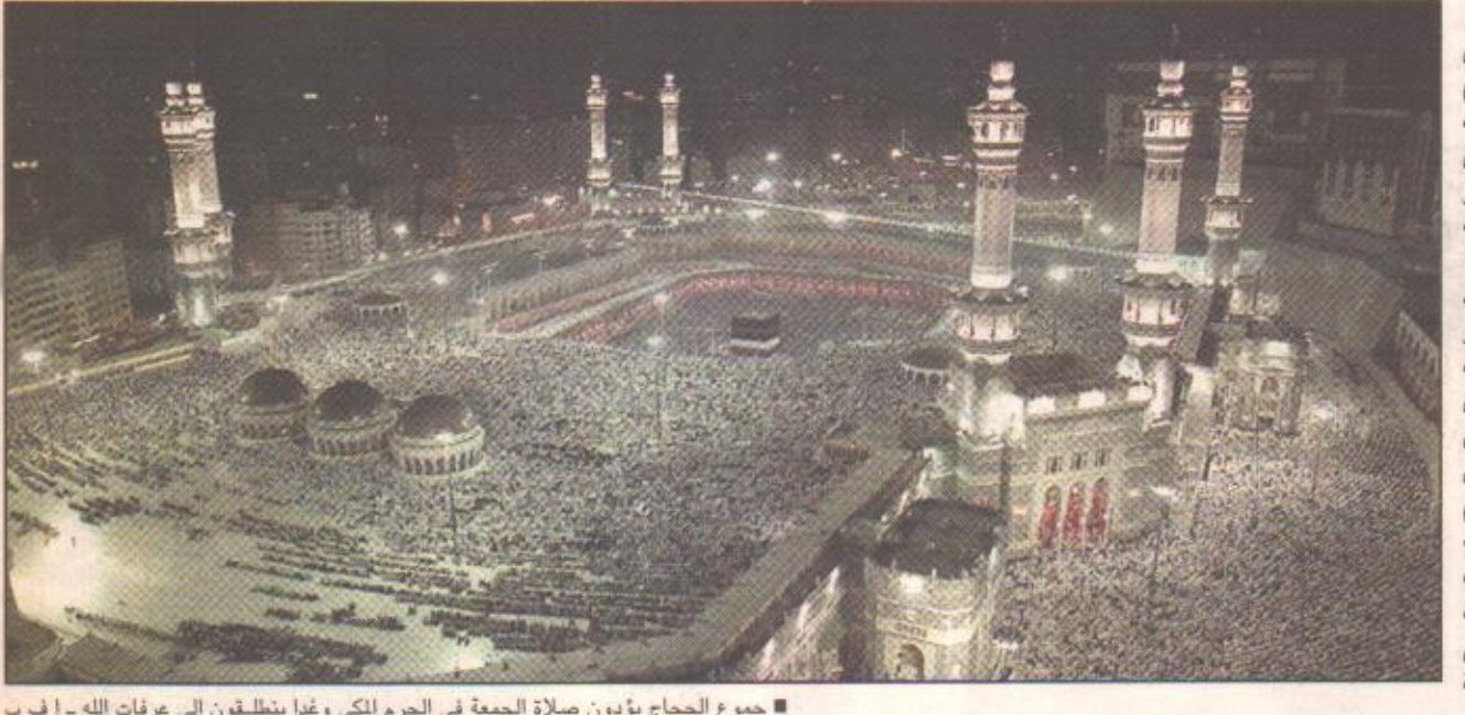
■ جموع الحجاج يؤدون صلاة الجمعة في الحرم الكي وغدا ينطلقون الى عرفات الله

بن عبدالعزيز وصاحب السمو الملكي الامير عبدالله بن عبدالعيزيز ولى العبهد ثائب رئيس مجلس الوزراء رئيس الصرس الوطني وصاحب السمو الملكي الامير سلطان بن عبدالعزيز النائب الثاني لرئيس مجلس الوزراء وزير الدفاع والطيران والمفتش العام الحرام. وتبدأ اليوم مصلحة المياه والصرف الصحى بمنطقة مكة المكرمة توزيع مياه مبرة خادم الصرمين الشريفين المبردة علي الحجاج باشراف ومتابعة فرق عمل مجندة