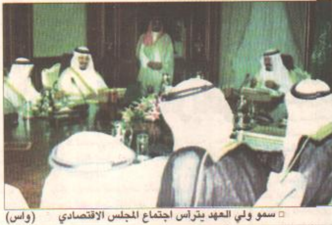
سمو ولي العهد يرأس اجتماع المجلس الاقتصادي (واس)

جدة/واس - ترأس صاحب السمو الملكي الأمير عبدالله بن عبدالعزيز ولي العهد نائب رئيس مجلس الوزراء رئيس الحرس الوطني رئيس المجلس الاقتصادي الأعلى أمس اجتماع المجلس الاقتصادي الأعلى الذي عقد بقصر السلام في مدينة جدة بحضور صاحب السمو الملكي الأمير سلطان بن عبدالعزيز النائب الثاني لرئيس مجلس الوزراء وزير الدفاع والطيران والمفتش العام نائب رئيس المجلس الاقتصادي الأعلى وأصحاب الشئون الاقتصادية من جهة أعضاء الهيئة الاستشارية للشؤون الاقتصادية. من جهة أخرى صدر أمر ملكي كريم بإعادة تشكيل الهيئة الاستشارية للشؤون الاقتصادية في المجلس الاقتصادي الأعلى وذلك لمدة ستة وأحد اعتباراً من ١٤٢٢/٦/١٢هـ. التفاصيل بالداخل