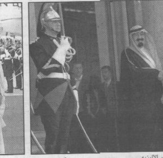
سموه شرف حفل العشاء في قصر الاليزيه