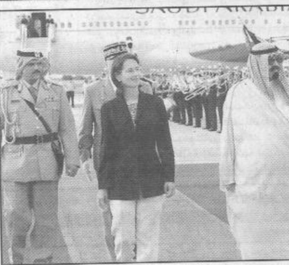
الأمير عبدالله لدى وصوله الى باريس

يركز التوجه السياسي السعودي الى حث الدول الأوروبية للمشاركة الفاعلة في دفع العملية السلمية في منطقة الشرق الأوسط، والدول الأوروبية مؤهلة بحكم انفالها السياسية لتلعب دورا متميزا في هذا الصدد حيث أكد الأمير عبدالله ابن عبدالعزيز ان دورها (ليس دورا كماليا ولا هو نشاط خيري) وبالتالي فان دول المجموعة الأوروبية لابد ان تتحمل ادوارها التاريخية والأخلاقية والسياسية للمشاركة الفاعلة في إيجاد الحلول الناجعة لازمة منطقة الشرق الأوسط التي تعد من أطول الأزمات السياسية المشهودة، ولن تحل بطريقة عادلة وشاملة ودائمة الا اذا اتصاعت اسرائيل للاصغاء الى صوت العقل والاحتكام الى الشرعية الدولية والقرارات الأممية ذات الشأن وقبلت بالبيانات السلمية دون انتقاء او تعديل يفرغها من محتوياتها، والدول الأوروبية قادرة على ممارسة ضغوطاتها على اسرائيل عبر وسائل متعددة لعل اقربها ابداء الاستياء الأوروبي الشامل من ممارسات اسرائيل القمعية ضد الشعب الفلسطيني وضد سائر الشعوب العربية والإسلامية والتلويح بقطاع المنتجات الاسرائيلية والعمل على تبيان التناقض بين مسالك اسرائيل الأوروبية من قيم ومثل، وبيزنز التوجه السعودي للتركيز على هذه المسألة من خلال جولات الأمير عبدالله ابن عبدالعزيز لعدد من الدول الأوروبية حيث حملته بالأمس الى فرنسا، وقبل أيام حملته الى كل من ألمانيا والسويد لتكريس هذا التوجه وبلورته.