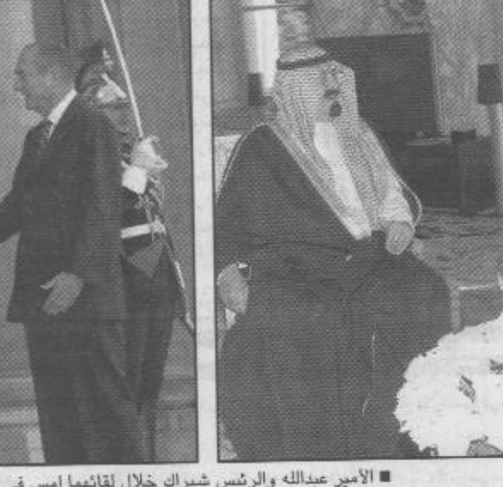
الأمير عبدالله والرئيس شيراك خلال لقائهما امس في قصر الاليزيه