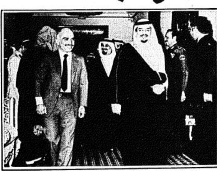
جلالة الملك فهد يصطحب العاهل الأردني قبل بدء مباحثاتهما

الرياض - واس - غادر جلالته الملك حسين عاهل الأردن امس بعد زيارة قصيرة للمملكة استغرقت عدة ساعات اجري خلالها مباحثات مع جلالته الملك فهد بن عبدالعزيز المفدى تناولت تطورات الوضع في المنطقة العربية بالإضافة الى العلاقات الثنائية بين البلدين. وكان في وداعه في المطار جلالته الملك فهد بن عبدالعزيز المفدى وصاحب السمو الملكي الامير عبدالله بن عبدالعزيز ونائب رئيس مجلس الوزراء ورئيس الحرس الوطني. وصاحب السمو الملكي الامير سلطان بن عبدالعزيز الثاني لرئيس مجلس الوزراء ووزير الدفاع والطيران. وصاحب السمو الملكي الامير سعود بن عبدالعزيز وزير الخارجية وامين مدينة الرياض عبدالله النعجم وعدد من كبار المسؤولين من مدنيين وعسكريين. هذا وكثرت العاهلان قد اجريت مباحثات هامة مساء امس.