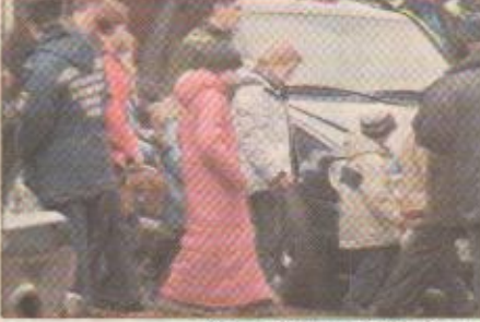
بعض الأطفال بعد الافراج عنهم

ازمة الرهائن في موسكو الجمعة ٢٥ الساعة ١٠:٠٠ تخ الخاطفون حوالي ٥٠ الرهائن حوالي ٧٠٠ شخص (بينهم ٧٥ اجانب و ٢٠ اطفال) هربوا ٢ قتلوا ١ افرج عنهم حوالي ٥ الامر الى طريق مسدود في اللحظة الأخيرة وتم تأجيل الموضوع.. فيما أكد المقاتلون أنهم جاهزون لانتحاريين جاؤوا إلى موسكو ليس للحياة ولكن لموت مهدين يقتل كل الرهائن وتجزير السرح بكامله اذا لم يستجيب الرئيس الروسي لمطالبهم بالانسحاب من الشيشان ووقف الحرب. قد أرجأ المقاتلون استعدادهم لإطلاق سراح ٣٠ اجنبياً في الوقت الذي قال فيه الناطق باسم خلية الأزمات الروسية الكسندر ماتفسكي ان الاتفاق خرق لأن الدبلوماسيين فشلوا في الوصول في الوقت المناسب لضمان إطلاق الرهائن. وتقول الأنباء ان من بين الـ ٧٠٠ المحتجزين في المسرح يوجد ٧٥ اجنبياً من بينهم أربعة أمريكيين وسمعة المان وهولنديان وأستراليان و٢٢ أوكرانيا وثلاثة أتراك وكندي وثلاثة بريطانيين وثلاثة جورجيين ومولدوفي. وقد وزعت وكالات التلفزة صوراً حديثة يعتقد أنها لقائد المجموعة الشيشانية التي تحتجز الرهائن في موسكو. وتظهر الصور شاباً في الخامسة والعشرين من العمر وهو يحد على الجهاد ضد روسيا. وقيل إن اسمه موفسار باراييف. وتظهر الصور أيضاً هجوماً نفذه المقاتلون الشيشانيون على قافلة عسكرية روسية فجروا فيها إحدى الشاحنات. وكانت السلطات الروسية وزعت الليلة قبل الماضية شريطاً مصوراً يبين عملية هروب بعض الرهائن من بين المئات الذين يحتجزهم المسلحون. ويظهر الفيلم ثلاث نساء يركضن بعد أن قفزن من نوافذ المسرح.