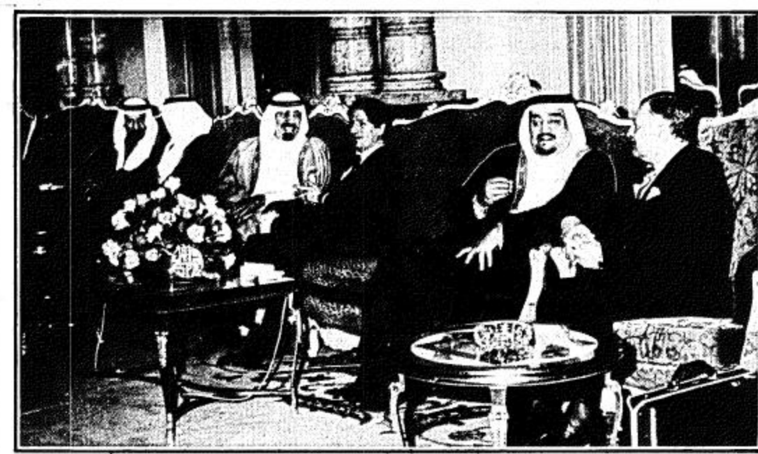
المباحثات جنبية بين العهد والوزان وبين الامير عبدالله والرئيس الجميل قبل حفل العشاء