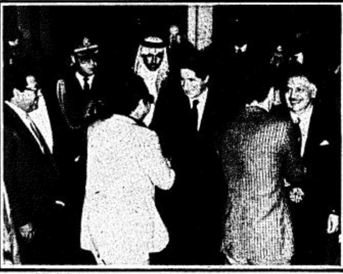
ثلاثة مشاهدين من وصول واستقبال الرئيس اللبناني امين الجميل الى الرياض