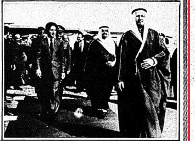
ثلاثة مشاهدين من وصول واستقبال الرئيس اللبناني امين الجميل الى الرياض