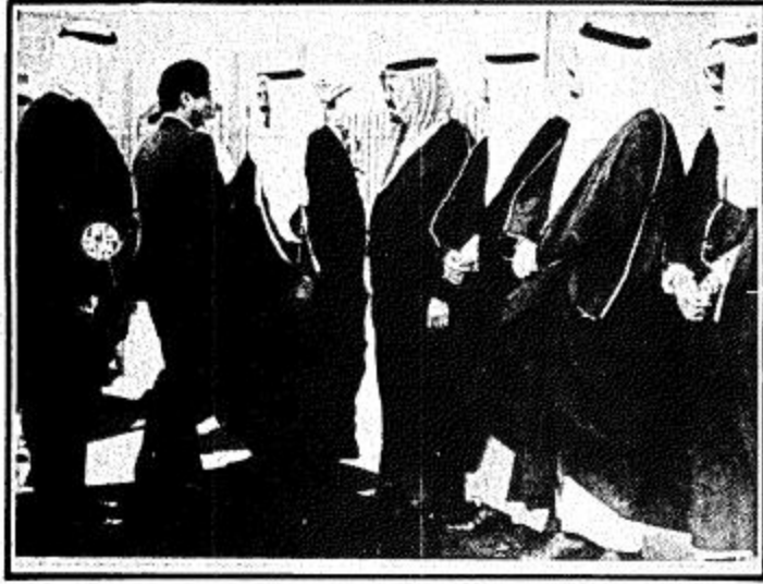
ثلاثة مشاهدين من وصول واستقبال الرئيس اللبناني امين الجميل الى الرياض