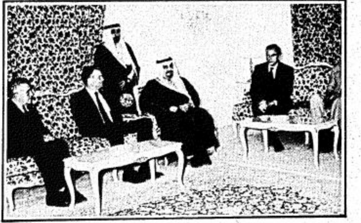
جلالة الملك أثناء استقباله وفد الكونغرس

استقبل جلالته الملك فهد بن عبد العزيز المفدى مساء أمس وفداً من أعضاء الكونغرس الأمريكي برئاسة رئيس اللجنة الفرعية للشرق الأوسط في هاميلتون الذي يزور المملكة حالياً. وقد حضر المقابلة صاحب السمو الملكي الأمير عبد الله بن عبد العزيز وزير الخارجية ورئيس مجلس الوزراء ورئيس الحرس الوطني وصاحب السمو الملكي الأمير سلطان بن عبد العزيز وزير الدفاع والطيران والمفتاح وزير الشؤون الخارجية.