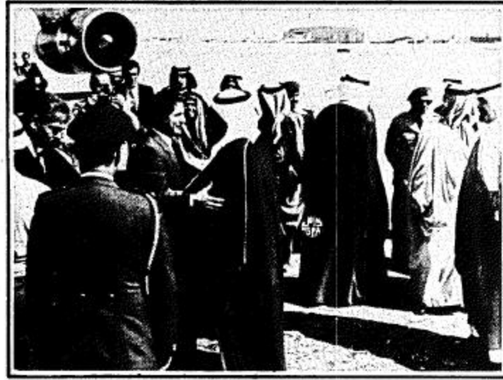
ثلاثة مشاهدين من وصول واستقبال الرئيس اللبناني امين الجميل الى الرياض