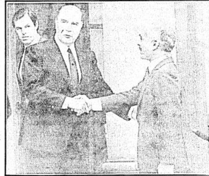
الرئيس الفرنسي ميتران والملك حسين يتصافحان

باريس - واس اجتمعت اللجنة العربية السابعة المنبثقة عن قمة فاس العربية برئاسة جلالة الملك حسين عاهل الأردن امس مع الرئيس الفرنسي فرانسوا ميتران وحضر الاجتماع كل من صاحب السمو الملكي الامير سعود الفيصل وزير الخارجية والامين العام لجامعة الدول العربية الشاذلي القليبي ووزير الخارجية الاردني مروان القاسم ووزير الخارجية التونسي الباجي قائد السبسي ووزير الخارجية الجزائري احمد طاب الابراهيمى نائب رئيس الوزراء ووزير الخارجية السوري عبدالحميد خدام ووزير الخارجية المغربي عز الدين العراقي ورئيس الدائرة السياسية بمنظمة التحرير الفلسطينية السيد فاروق فدوي. كما حضر الاجتماع من الجانب الفرنسي وزير العلاقات الخارجية كلود شيسون.