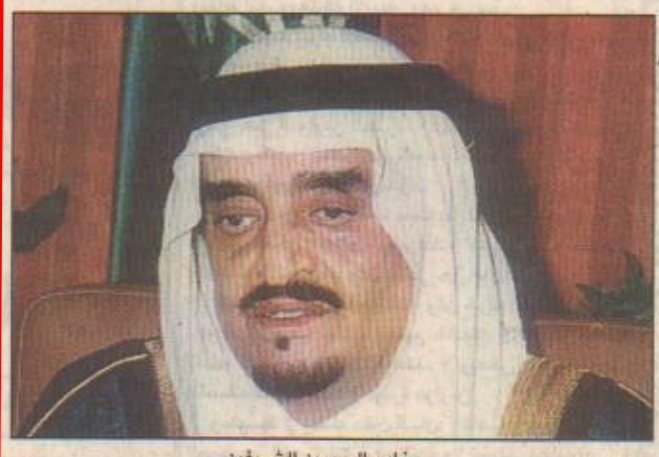
خادم الحرمين الشريفين

الرياض/واس استقبل خادم الحرمين الشريفين الملك فهد بن عبدالعزيز آل سعود بمكتبه في قصر اليمامة أمس معالي الأمين العام المساعد للأمم المتحدة والبعوث الخاص للأمين العام في أفغانستان الأخضر إبراهيمي، وحضر الاستقبال صاحب السمو الملكي الأمير عبدالعزيز بن فهد بن عبدالعزيز وزير الدولة وعضو مجلس الوزراء ومعالي المستشار الخاص لخادم الحرمين الشريفين إبراهيم العنقري ومعالي وزير الدولة وعضو مجلس الوزراء الدكتور عبدالعزیز الخويطر. من جهة أخرى بحث خادم الحرمين الشريفين الملك فهد بن عبدالعزيز آل سعود برفيعة تهنته في فخامة الرئيس العفدي يحيى جامع رئيس جمهورية غامبيا بمناسبة ذكرى استقلال بلاده، وأعرب الملك الفهدى باسم شعب وحكومة المملكة العربية السعودية وباسمه شخصياً عن أصدق التهاني مفرقة بالتمنيات الودية بدوام الصحة والسعادة لفخامته ولشعب غامبيا الشقيق بالتقدم المطرد والإزهار الدائم.