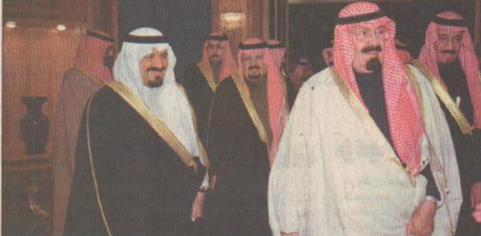
سمو ولي العهد وسمو النائب الثاني في حفل مدارس الرياض

الرياض/واس رعى صاحب السمو الملكي الأمير عبدالله بن عبدالعزيز ولي العهد ونائب رئيس مجلس الوزراء ورئيس المجلس الوطني مساء أمس حفل مدارس الرياض بمناسبة مرور مائة عام على تأسيس المملكة الذي أقيم بقرى المدارس بمدينة الرياض. كما قام سموه بتكريم المتفوقين من خريجي الثانوية العامة من المدارس لعامي ١٤١٧ / ١٤١٨ و١٤١٩ / ١٤١٨ وتسلم هدية من صاحب السمو الملكي الأمير سلمان بن عبدالعزيز أمير منطقة الرياض الرئيس الفخري لمدارس الرياض عبارة عن درج تكاريبة بهذه المناسبة. كما شارك ألف طالب في استعراض ملحمة البناء تحت عنوان «ملحمة البناء» مملحة سعودية، وكان في استقبال سمو ولي العهد لدى وصوله إلى مقر الحفل صاحب السمو الأمير سلمان ومعالي وزير المعارف بالإنابة وكبار المسئولين في مجلس إدارة المدارس، وبدأ الحفل بالقرآن الكريم. والقى مدير عام المدارس عبدالرحمن بن سعود العجالي كلمة أسرة المدارس رحب في مستهلها بسموه ولي العهد والحضور فمما أشكر والتقدير لسموه على رعايته هذا الحفل، وأشار إلى أن ما بين حفل هذا العام وتزامن مع