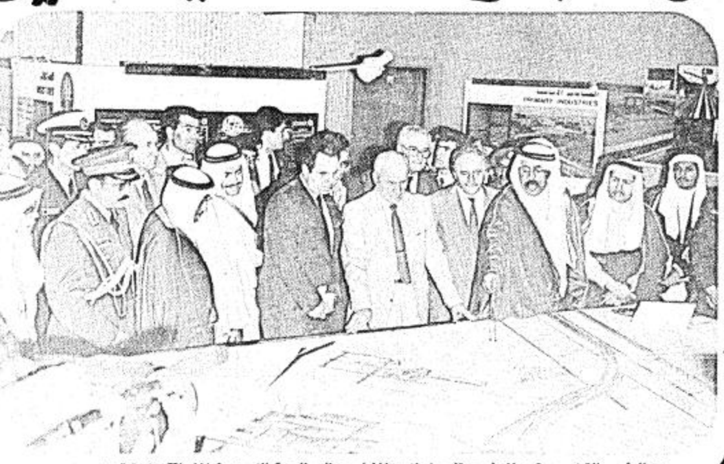
الرئيس التركي يستمع الى شرح تفصيلي لاجد المشاريع الصناعية الكبرى في المنطقة الشرقية

الرياض - واس - عاد الى الرياض بعد عرس امس فخامة الرئيس التركي كنعان اوفين قادما من الجيبيل بعد زيارة قصيرة اطعم خلالها على الاجازات الصناعية التي تحققت في المدينة. وكان في وداغ فخامة بطار الجيبيل معالي وزير التخطيط شام ناظر واسير مدينة الجيبيل احمد السفر وامين عام الهيئة الملكية للجيبيل وينبع الدكتور فاروق اخروعد من المسؤولين. هذا وكان فخامة الرئيس التركي قد قام والوفد المرافق له بعد ظهر امس بزيارة لقرى الهيئة الملكية للجيبيل وينبع والمدينة الصناعية والجيبيل وقد قدم امين عام الهيئة الدكتور فاروق اخروعد شرحا عن فكرة انشاء الهيئة واهدافها والانتجازات التي حققتها واكد في كلمة القاها خلال الزيارة فخره المملكة في تحقيق المنجزات الصناعية وملاحظة التطور في المجال الصناعي وفند التطور فاروق اخروعد التي تشكك في قدرة المملكة في المجالات الصناعية مشيرا الى انه قد تم بفضل الله بمجهود المملكة