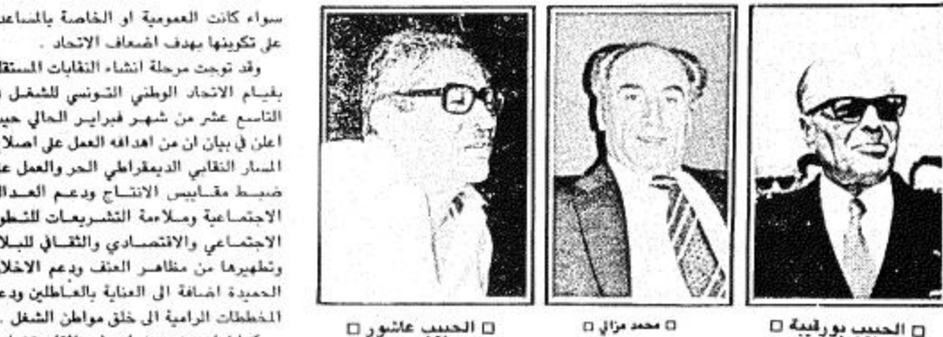
الحبيب بوريقية □ محمد مزي □ الحبيب عاشور □

العاصم - الوكالات - ق ن ا - ذكر وكالة الانباء الفلسطينية وفا امس ان السيد ياسر عرفات رئيس اللجنة التنفيذية لمنظمة التحرير الفلسطينية سيوجه الى العاصمة الاردنية خلال الاربع والعشرين ساعة القادمة يرافقه وفد يضم عدداً من اعضاء اللجنة التنفيذية للاجتماع مع جلاله الملك حسين عامل الاردن وكبار المسؤولين الاردنيين ويحث سوسوع التوصل الى تفاهات الكونغرس واستقبال المباحث المشتركة. وقالت الوكالة ان مسعود المباحث الفلسطينية الاردنية كان محل دراسة وتفاهات في اجتماع مطول عقدت الليلة قبل الماضية اللجنة المركزية لحركة فتح بحضور السيد ياسر عرفات الى جانب عدد من الموضوعات الاخرى التي من أهمها نتائج المشاورات الجارية مع المنظمات الفلسطينية لتحديد موعد انعقاد المجلس الوطني الفلسطيني.