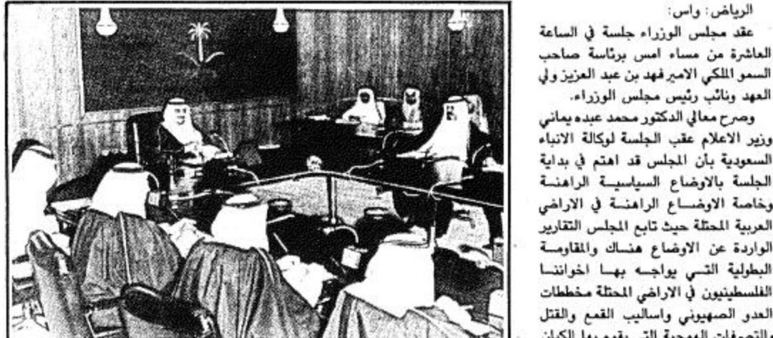
العهدة يترأس مجلس الوزراء

الرياض: واس عقد مجلس الوزراء جلسة في الساعة العاشرة من مساء امس برئاسة صاحب السمو الملكي الامير فهد بن عبدالعزيز ولي العهد ونائب رئيس مجلس الوزراء. وصرح معالي الدكتور محمد عبيد يمانى وزير الاعلام عقب الجلسة لوكالة الانباء السعودية بأن المجلس قد اهتم في بداية الجلسة بالاراضع السياسية الراهنة وخاصة الاراضع الراهنة في الاراضي العربية المحتلة حيث تابع المجلس التقارير الواردة عن الاراضع هناك والمقايمة البطولية التي يواجه بها اخواننا الفلسطينيين في الاراضي المحتلة مخططات العدو الصهيوني واساليب القمع والقتل والتفريغ الهجيم التي يقوم بها الكيان