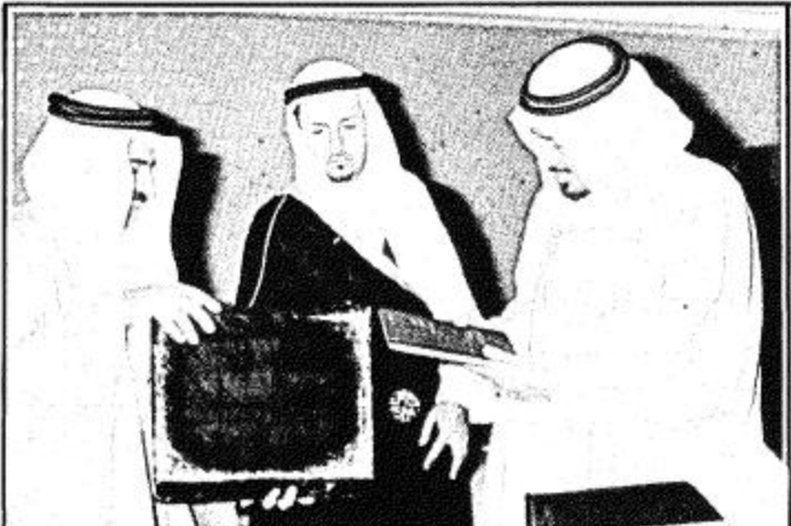
جلالة الملك يتسلم التقرير

الرياض: واس تسلم جلالة الملك خالد بن عبدالعزيز في مكتب جلالاته بالديوان الملكي بالمعذر صباح امس التقرير السنوي العشرين لمؤسسة النقد العربي السعودي وقد تشرف برؤيته لجلالاته معالي الشيخ عبدالعزیز القرشي محافظ المؤسسة الذي قدم ايضا شرحا تفصيليا بنسبة النمو التي حققها المئكة خلال العام ١٤٠٠/١٤٠١ هـ. وقد حضر مناسبة التقديم صاحب السمو الملكي الامير عبدالله بن عبدالعزيز النائب الثاني لرئيس مجلس الوزراء ورئيس الحرس الوطني ومعالي الشيخ محمد ابا الخيل واعضاء مؤسسة النقد. ويوضح التقرير معدل النمو غير النفطي في الانتاج المحلي الذي حقق في العام ١٤٠١/١٤٠٠ هـ بنسبة ١٢٪. الى جانب ارقام وحقائق عن موارد المئكة ومصروفاتها خلال ذلك العام وجميعها تشير الى سير برامج التنمية والادارات وفق ما هو مرسوم لها.. واحيانا بشكل فاق المتوقع. (طالع نص التقرير داخل العدد)