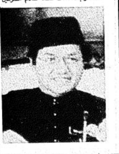
السفير سيد ابوزيد له الجزيرة

استقبل معالي وكيل وزارة الخارجية للشؤون السياسية الأستاذ عبد الرحمن منصورى بمكتبه بوزارة الخارجية أمس سفير الجابون لدى المملكة السيد اسماعيل نافو كما أراس الذي سلم (البيعة ص ٢٢)