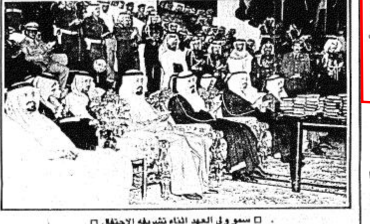
سمو ولي العهد أثناء تشريفه الاحتفال □

كسا دعا الهويات الدولية المختصة الى متابعة هذا الموضوع بصورة جادة لمح تامين الاشراف الدولي الامن وحذر الناطق بحكم ايران اذا ما حاولوا مرة اخرى العدوان على ارض وسياة العراق وقال اننا سنكون لهم كما كنا اننا بالرهصاد وسندمر هجماتهم ونذيقهم الهزيمة المرة كما فعلنا في كل المعارك السابقة التي لم ينجحوا منها غير الخيبة والخسران. هذا كما ذكر العراق مجدداً دعمه وترحيبه بكل الجهود المبذولة لتنازع مع ايران. جاء ذلك في رسالة جوابية بعث بها نائب رئيس الوزراء وزير الخارجية العراقي السيد