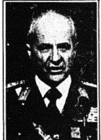
الرئيس التركي كنعان أفشين □

كتب محمد الوكيل.. يصل الرئيس التركي كنعان أفشين للرياض غداً الثلاثاء على رأس وفد تركي يضم عدداً من الوزراء وكبار المسؤولين في الحكومة التركية بدعوة رسمية من أخيه جلالة الملك المفدى. وقد ركزت أجهزة الاعلام التركية على ما لهذه الزيارة من أهمية حيث تعتبر أول زيارة يقوم بها الرئيس التركي للمملكة منذ ان تولى مقاليد السلطة في سبتمبر ١٩٨٠م. كما اهتمت الاساطير السياسية بمغزى الزيارة وما ستفرغه من نتائج ايجابية. هذا وقد اشاد الرئيس التركي كنعان أفشين بالدور القيادي والبناء الذي تلعبه المملكة بقيادة جلالة الملك المفدى لخدمة الاسلام والمسلمين. ونصرت القضايا العربية والاسلامية. واتى بصيغة خاصة على جهود جلالة المستمرة والمضيئة لرفع راية الاسلام مع الصحافة المحلية السعودية قال لـ «الجزيرة» والرياح، وعكاظ، ان الوفد الذي يرأسه فخامة الرئيس سيناقش مع جلالة الملك مفه سبل توطيد اركان العلاقة الاخوية واواصر الصداقة بين المملكة وتركيا والعمل على زيادة التعاون التجاري بين البلدين.. حيث ان هناك العديد من المصالح التي تعود بالنفع على الشعبين السعودي والتركي. كما سيناقش الوفد سبل تدعيم التعاون الثقافي بين البلدين وبالنسبة لشبكة الشرق الاوسط والصراع في لبنان والحرب العراقية الايرانية قال الناطق الرسمي: ان تركيا تتربط الاوضاع في لبنان من كتب وبصورة مستمرة لقرابا من الحدود التركية.. واضاف: ان ما يجري الان من صراع في الشرق الاوسط له تأثيره البالغ على تركيا.. ومجريات الامور تحتم علينا ان نتفكر بحذر الى تلك الصراعات. [القبلة على ص ٣٠]