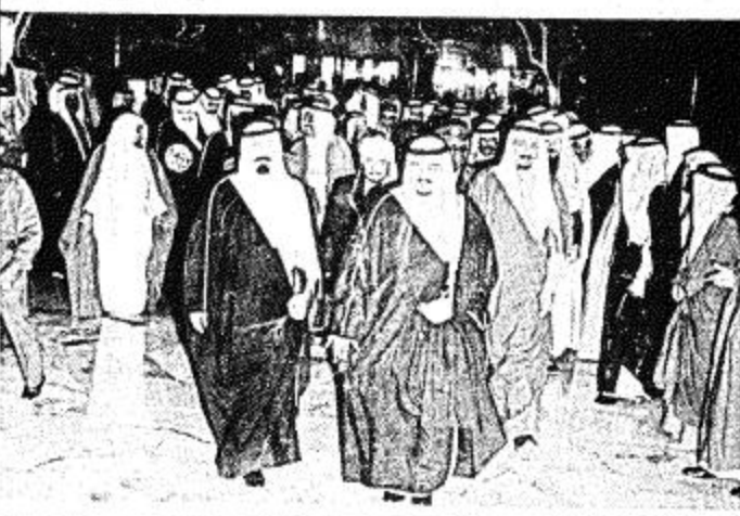
لقطة من استقبال جلالته الملك المفدى □

الرياض - واس - عاد بسلامة الله وحفظه الى ارض الوطن مساء امس حضرة صاحب الجلالة الملك المفدى ابن عبد العزيز المفدى اثر حضور جلالة مؤتمر القمة الاسلامي الابع الذي عقد في الدار البيضاء ويعد ان قام جلالتهم بزيارة بعض العواصم الاوروبية والتي كانت محل اهتمام بالغ من جميع الاساطير السياسية والدبلوماسية العربية والدولية. وقد كان في استقبال جلالتهم لدى وصوله الى مطار الملك خالد الدولي بالرياض صاحب السمو الملكي الامير عبد الله بن عبد العزيز ولي العهد ونائب رئيس مجلس الوزراء ورئيس الحرس الوطني واصحاب السمو الملكي الامراء معتمدين بن عبد العزيز وزير الاشغال العامة والاسكان ويدر بن عبد العزيز نائب رئيس الحرس الوطني ونواب بن عبد العزيز ونائب بن عبد العزيز وزير الداخلية وسلمان بن عبد العزيز امير منطقة الرياض وعبد الالاه ابن عبد العزيز امير منطقة القصيم وسلام بن