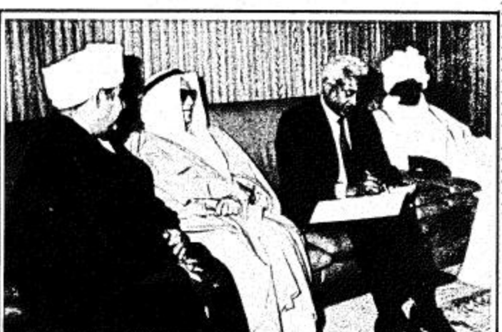
٤ اربع لغات من لغات سوار الذهب بالجمالية السودانية بالرياض